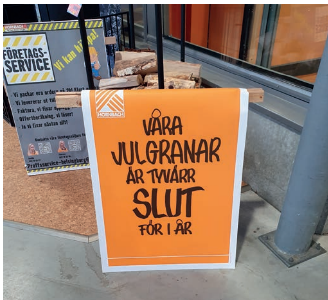
Skilt med udsolgte træer hos Hornbach i Helsingborg den 20. december.

Meget af salget foregik derfor fra plantecentre som Plantagen, hvor udvalget dog også var begrænset og fra stude-