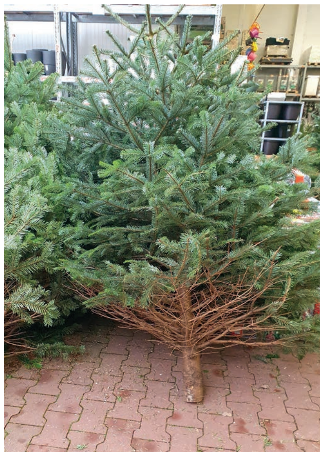
Naturligt nåletab i træernes indre var sammen med risikoen for mudder på træerne en af de store udfordringer i 2023. Foreningen lavede derfor et notat om det naturlige nåletab på flere sprog. ▶

Det vigtige tyske marked blev besøgt tidligt, og danske træer var rigt repræsenteret i både kædesalg og studepladssalg. De danske træer i kædesalget havde gennem-