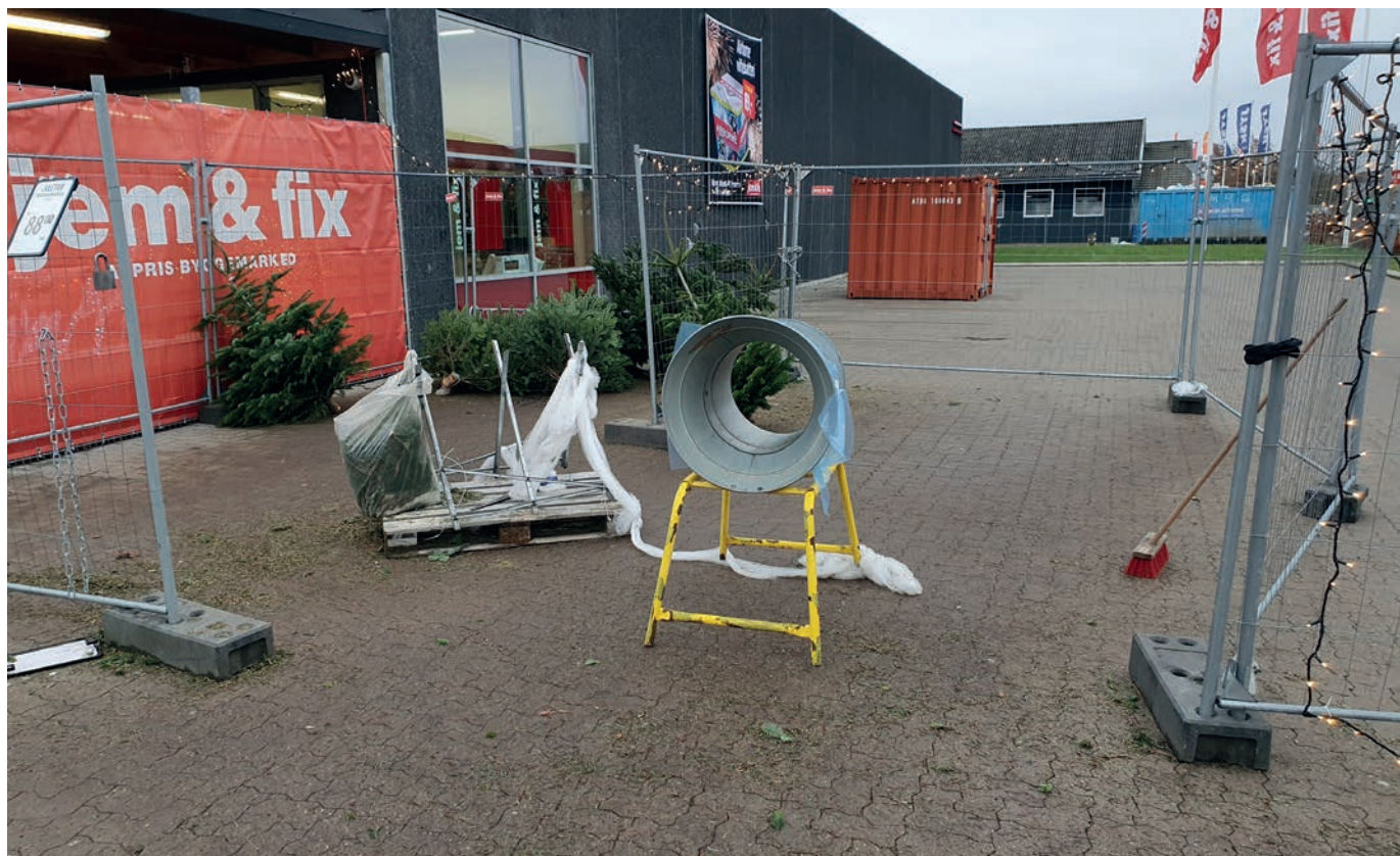
Næsten tom plads hos Jem & Fix i Farum den 17. december 2023.