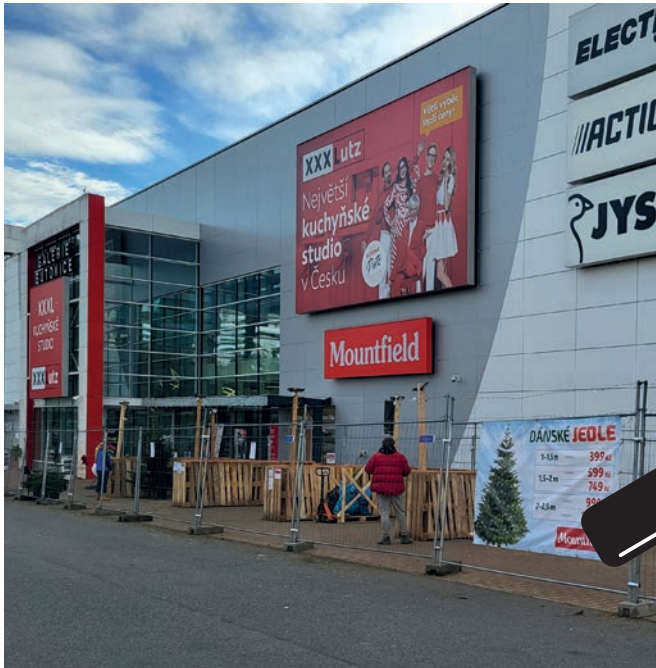
Denne filial af Mountfield i Prag var totalt udsolgt, og det samme gjaldt en masse andre filialer.