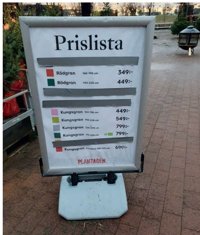
Prisliste fra Plantagen nær Malmø, hvor de udgåede højder/sorter er fjernet. I andre filialer blev der holdt brandudsalg over de sidste meget få træer.

pladshandlere. Flere studehandlere anførte, at de manglede træer i den gængse størrelse mellem 1,5 og 2,0 meter, hvorfor de så sig nødsaget til at reducere højden på større træer.