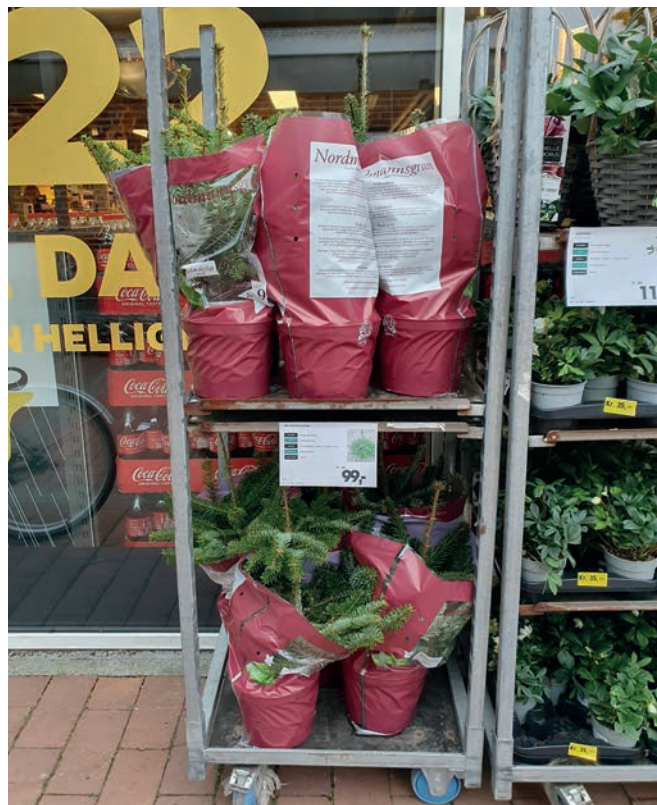
Salg af småtræer i supermarkeds kæderne er blevet populært.

Fæld-selv salget gik rigtig godt og især vintervejret op mod jul hjalp til. Flere valgte at hæve priserne, og det er vores oplevelse, at det ikke gav nævneværdige bemærkninger fra forbrugerne. 📌