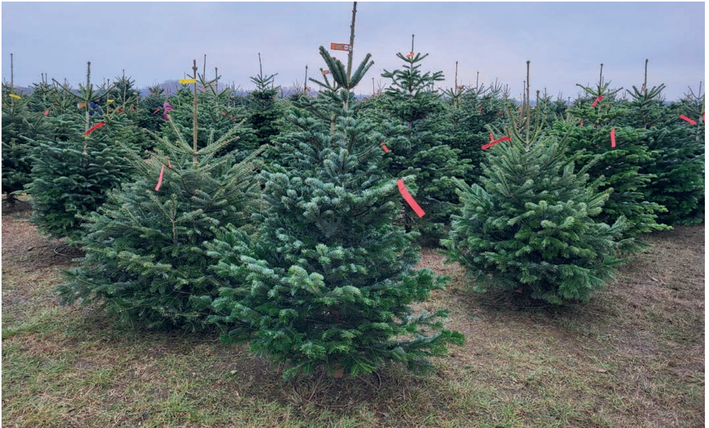
Stadeplads på en mark lige op ad et indkøbscentrum i forstad til Budapest. Træerne er danske, og de røde mærker er prisskilte. Det forreste træ kostede 20.000 ungarske forint (ca. 400 DKK). Et primatræ over 200 cm kostede omtrent det dobbelte.