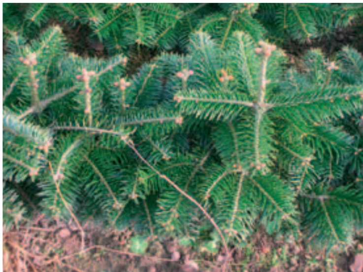
Salgsklare 2/2 planter.