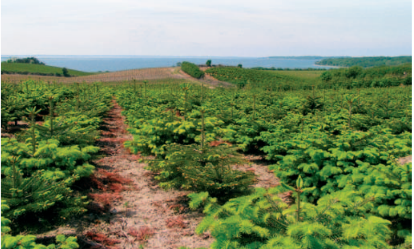
Udsigten er flot fra ejendommen, hvor det hælder svagt ned mod vandet.

Normalt udføres bredsprøjtning med 1,5 l Roundup pr. ha. første gang i april måned