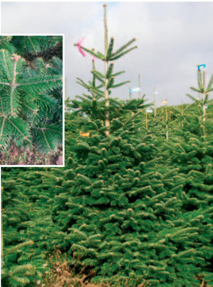
Salgsklare træer – kulturen ryddes.

Tågesprøjter fra én af Europa's førende fabrikker i specialsprøjte Trailersprøjter fra 1.000 l – 3.000 l Liftsprøjter fra 400 l – 1.000 l