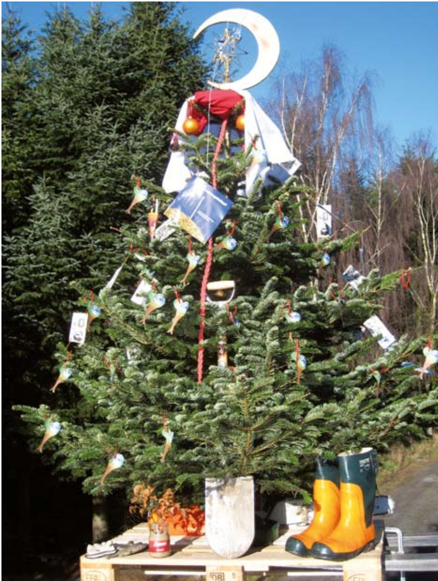
Det bæredygtige, naturnære muslimske skifte/solhvervs/juletræ træ. Dette træ er fældet den 15/8 2008, vandt 3. præmien på Langesømessen og lå udenfor i skygge frem til 1/11, hvor prototype 1 udformes og træet kommer i vand.