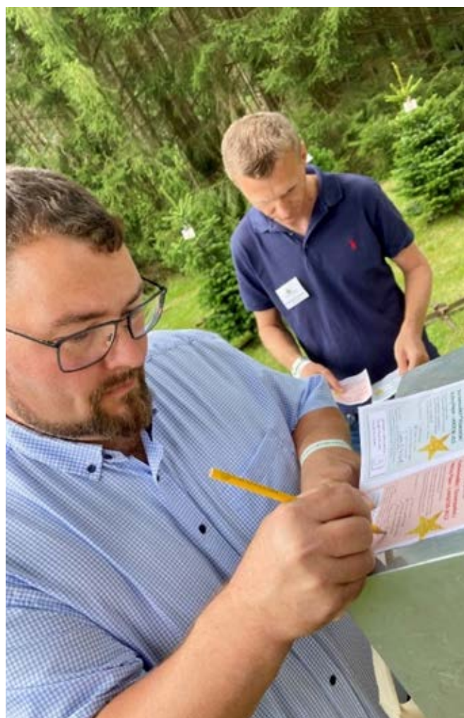
Danmarks flotteste juletræ findes af messens gæster via fysisk afstemning på de udleverede stemmesedler.

Konkurrencen fungerer som et udstillingsvindue for alle de deltagende producenter, som får anledning til at vise deres træer frem for messens besøgende. Naturligvis får vinderne mest eksponering-, både på messen og i fagpressen – Nåledrys, Nadel Journal og flere landbrugsmedier. Vi ønsker vinderne tillykke, og takker alle dem, som indleverede et juletræ.