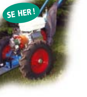
CE-mærket og brugsmodeibeskyttet.