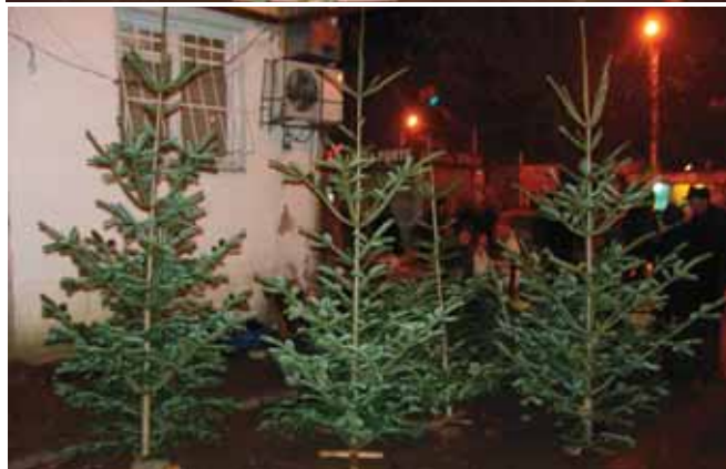
Aftenstemning med nordmannsgranjuletræer på en markedsplads i midten af Batumi, Georgiens 3. største by og Kartlos hjemby.