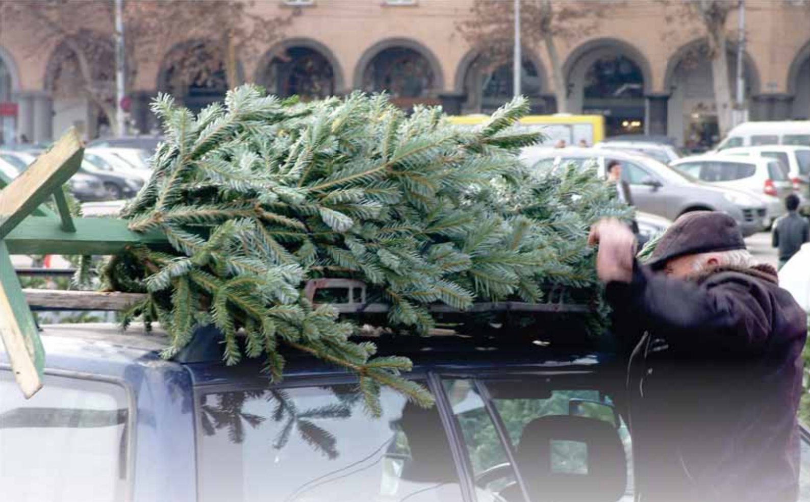
Et øko-træ transporteres hjem. Læg nøje mærke til, hvordan det er lykkes med grene af nordmannsgran at efterligne et rigtig træ!

træstyper koster. Nordmannsgran er trods dette nemme at sælge, særlig hvis man som sælger kan oplyse kunderne om, at træerne kommer fra en planteskole eller fra udlandet! Men det gør de højst sandsynligt ikke! Nordmannsgranerne kommer formodentlig fra naturskovområderne i Ambrolauri, Borjomi,