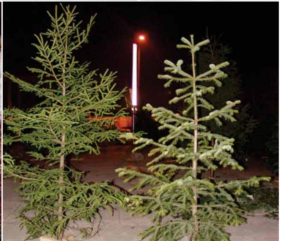
Nogle kvaliteter kan kun sælges ved måneskin!