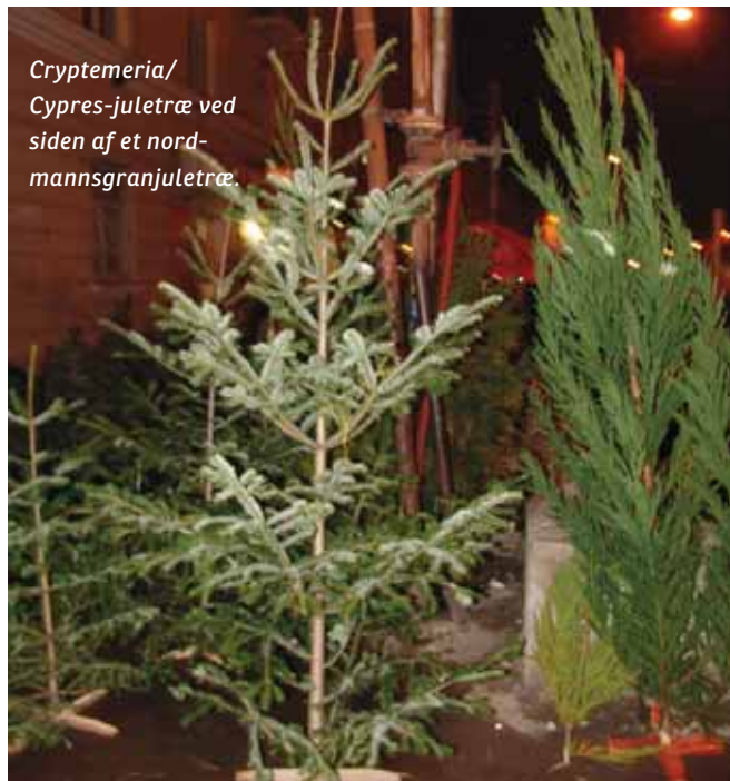
Cryptomeria/ Cypres-juletræ ved siden af et nord- mannsgranjuletræ.

Det er den rigeste del af befolkningen, som køber nordmannsgran. Priserne for denne træart er høje, gennemsnitlig 17 Euro pr. meter. Det er mere end det dobbelte af, hvad alle andre jule-