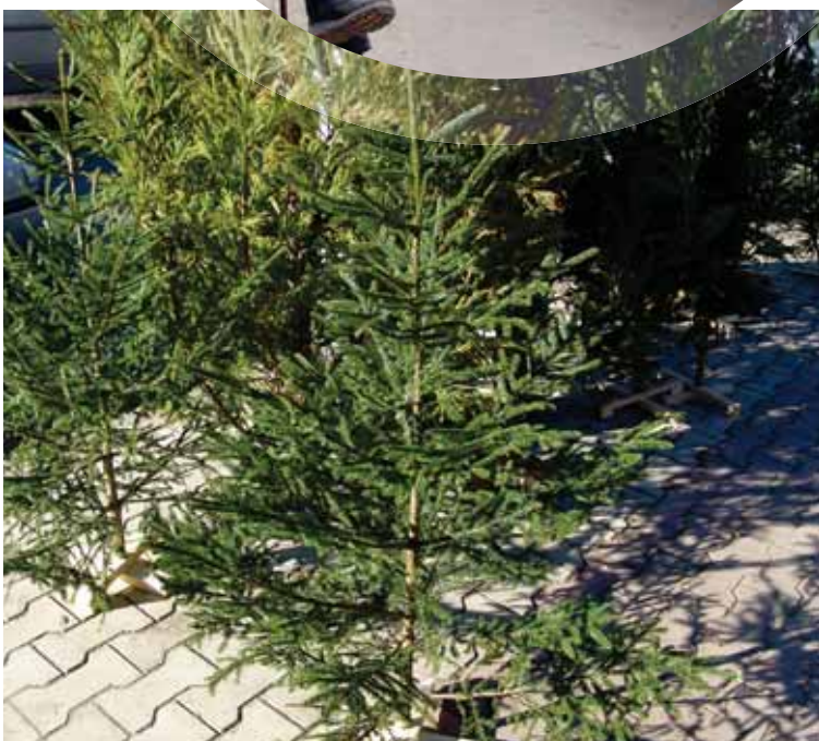
Gran- og cypres-juletræer.