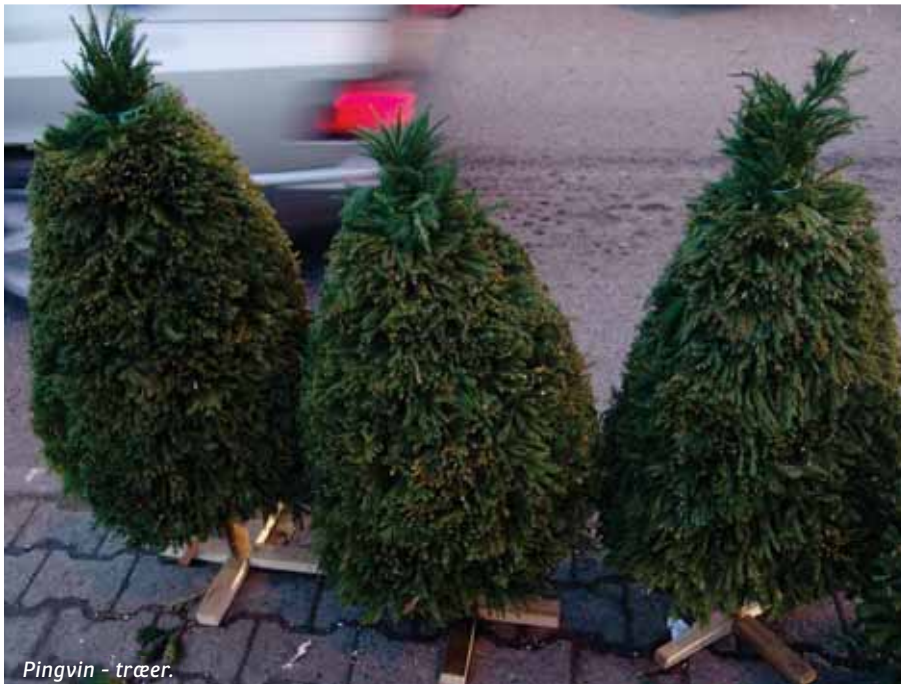
Pingvin - træer.