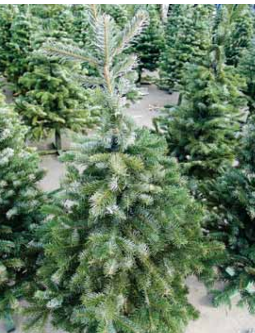
"Øko-træ" (markedsandel tæt på 30 %). Efterligning af en rigtig nordmannsgran lavet af stav og grene.