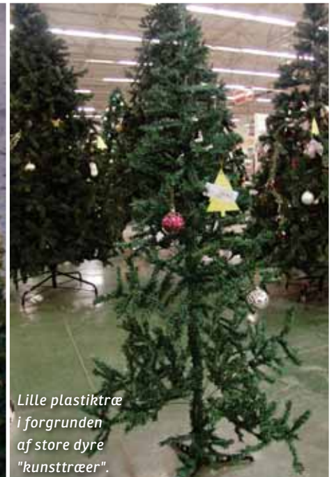
Lille plastiktræ i forgrunden af store dyre "kunsttræer".