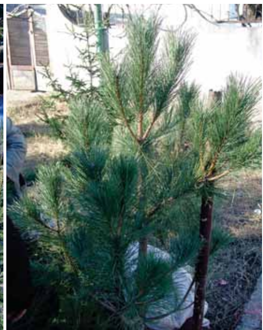
Fyr bruges som juletræ (Markedsandel 2 %). Der anvendes tilsyneladende flere fyrre-arter som juletræer.