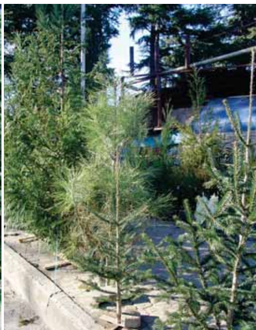
Alt kan sælges som juletræ i Georgien.