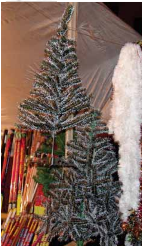
Plastiktræer sælges ofte sammen med nytårsfyrværkeri. Begge produkter kommer fra Kina.