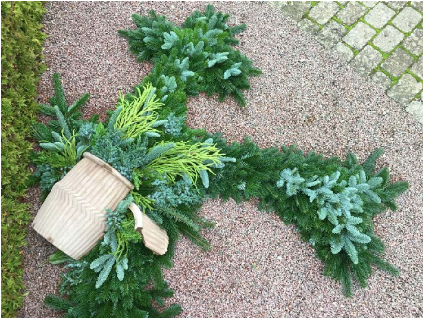
Grandækning udføres ofte meget kreativt af medarbejderne på kirkegården. Her er det fra Søften og Foldby kirkegårde, hvor de forskellige typer stedsegrønne planter virkelig skaber farvespil i udsmykningen.

klippegrønt. Men siden det langt fra er alle steder, at det er muligt at købe økologisk, så er det værd at kigge på, hvilke arter af gran, der kræver mindst sprøjtemiddel – det kunne f.eks. være rødgranen, som ellers er gledet meget ud af brug. Dette kan bl.a. skyldes den ringere holdbarhed indendørs, men for kirkernes vedkommende skal de som regel kun bruge ét stort træ indendørs, og derudover flere små træer udendørs, ligesom de skal bruge en større mængde klippegrønt. Og så har rødgranen måske igen en chance som juletræ, idet den holder bedre ved at stå udenfor. Så er der spørgsmål om æstetik og præferencer, men det lader vi ligge for nu og fokuserer på bæredygtighedsaspektet. Des-