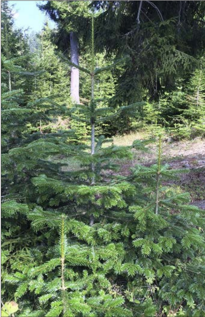
Naturlig foryngelse i Beshumi, 2000 m over Sortehavet. Optimal vækst, men på grund af tidlig snedække ikke velegnet til juletræsdyrkning.

for nordmannsgran-juletræer i Havnebyen Batumi ved Sortehavet.