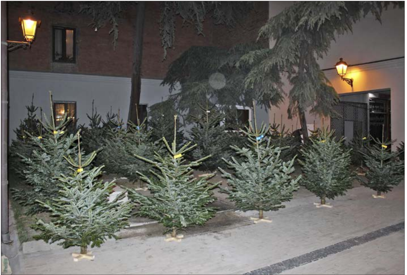
Mine første træer fra Danmark til markedet i Tbilisi i Georgien.