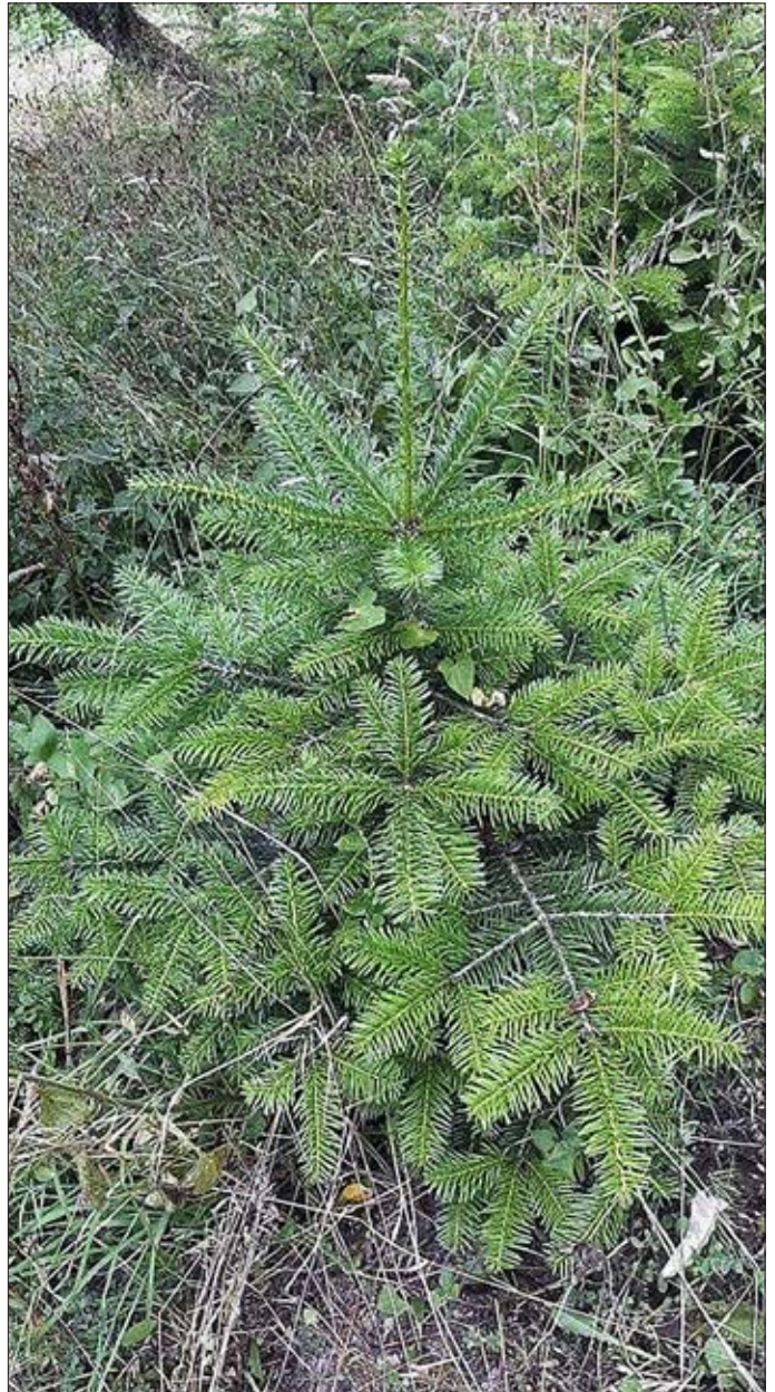
7-årig nordmannsgran plantet i Vashlovani, ca. 1000 meter over havet. Den blev plantet som en dækrodsplante, afstamning Borjumi.

I Vashlovani har jeg efter 8 års søgning fundet den lokalitet, som jeg tror på. Her planlægger jeg at tilplante en lille mark på ca. 1 ha i foråret 2022. I oktober 2021 laver jeg en forpagtningsaftale.