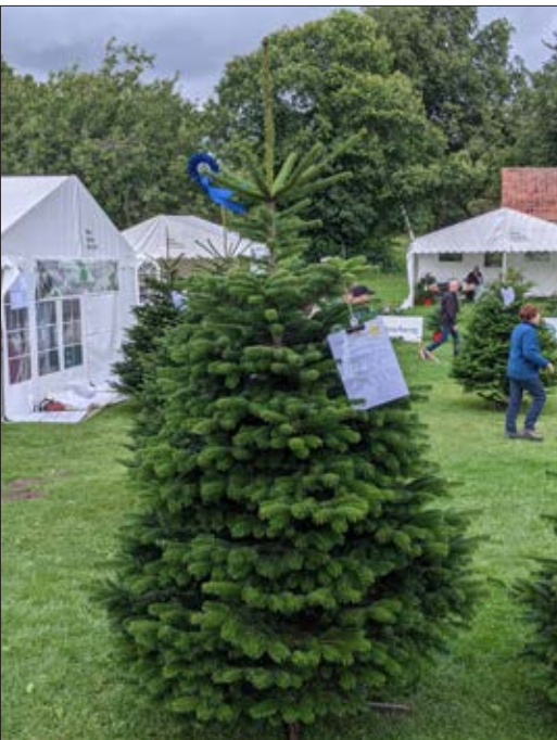
2. præmien gik til denne nordmannsgran fra Clausholm.