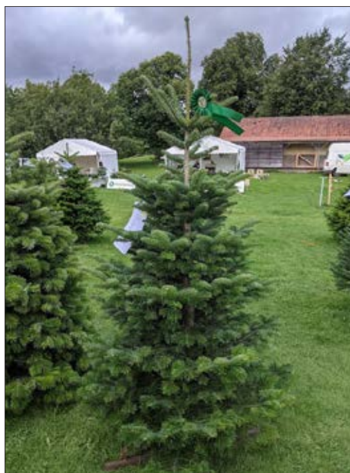
3. præmien for andre arter gik til denne bornmüllergran fra Maglesø Plantage.