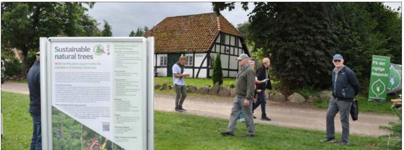
Certificeringstilbuddet Bæredygtige naturtræer blev præsenteret på plakater på dansk, tysk og engelsk.

Danske Juletræer tog imod alle interesserede til en snak blandt andet om foreningens afsætningsarbejde, herunder markedsportalen (Nåledrys 116), om projekt FRIJUL om sprøjtefrie juletræer (Nåledrys 113) og om den opdaterede digitale skadenøgle.