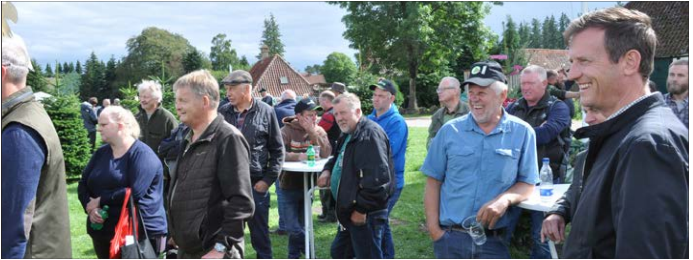
Opløb foran Danske Juletræers stand.

Der var flere besøgende end sidste år og begyndende optimisme på årets Langesømesse. Nyheden fra Danske Juletræer var et certificeringstilbud for bæredygtige naturtræer.