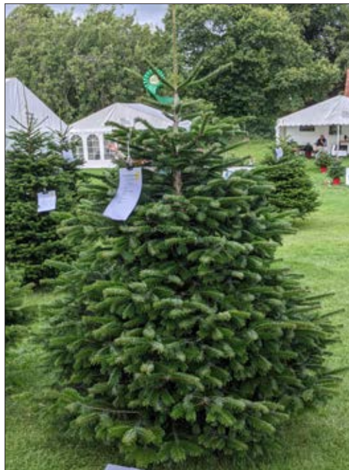
3. præmien gik til denne nordmannsgran fra Raahavegaard.