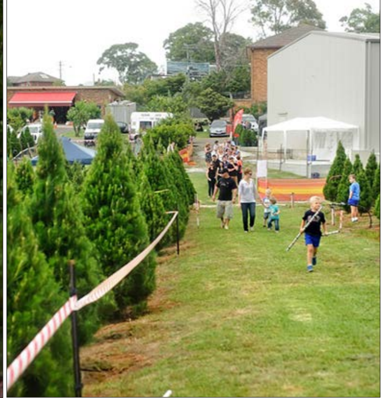
Stuetræ med snowlock