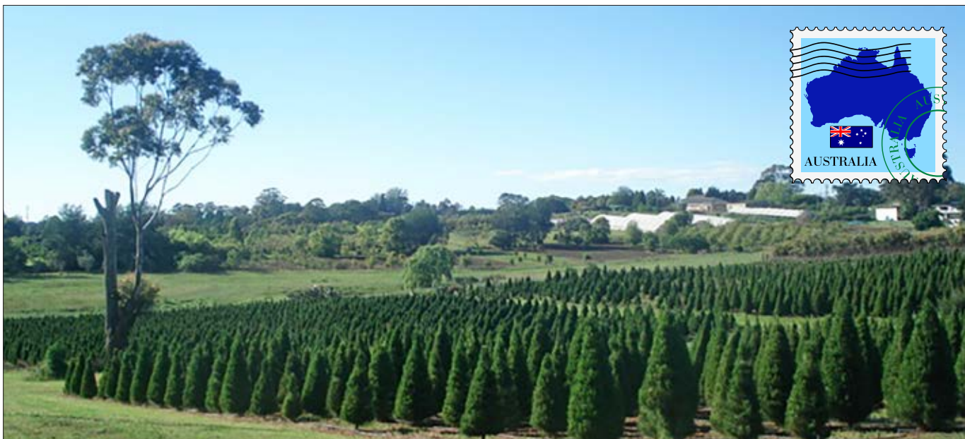
Udsnit af farmens marker