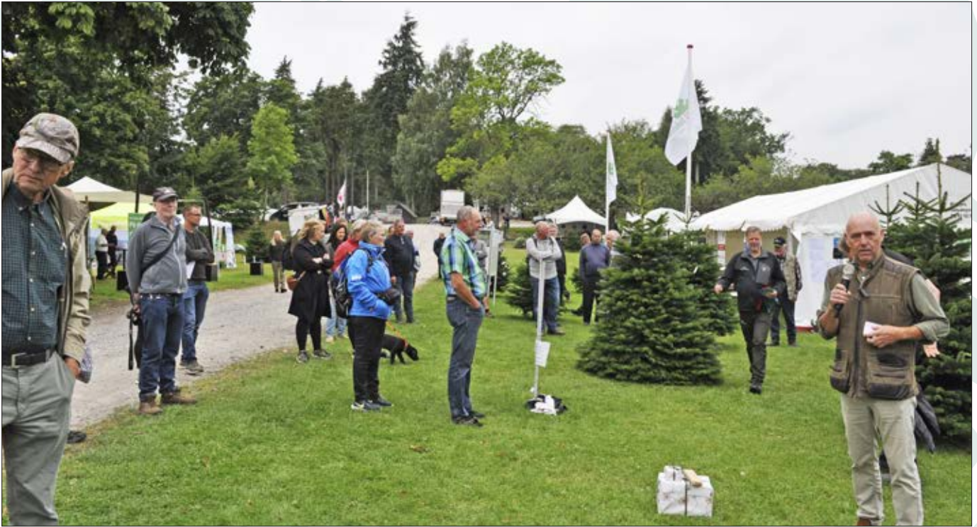
Folk venter spændt på pladsen ved Danske Juletræers stand til præmieoverrækkelsen og offentliggørelsen af årets vindere i konkurrencen om Danmarks flotteste juletræ.