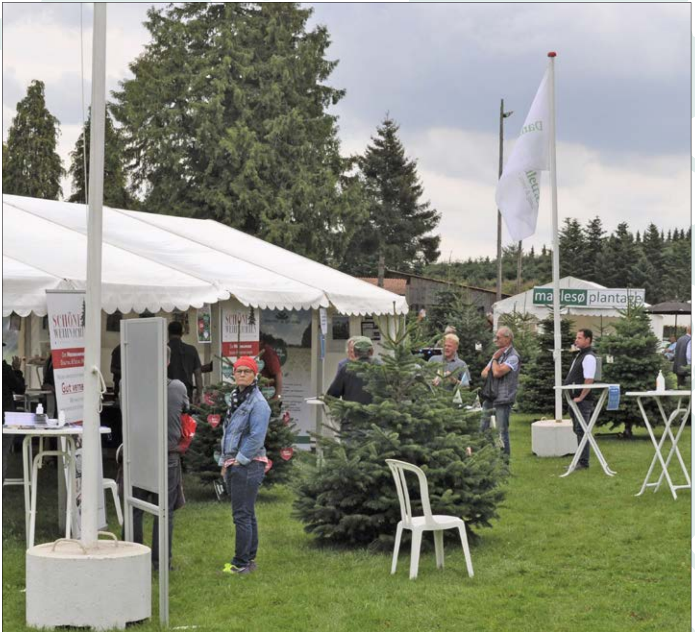
Danske Juletræers stand var velbesøgt gennem hele dagen.