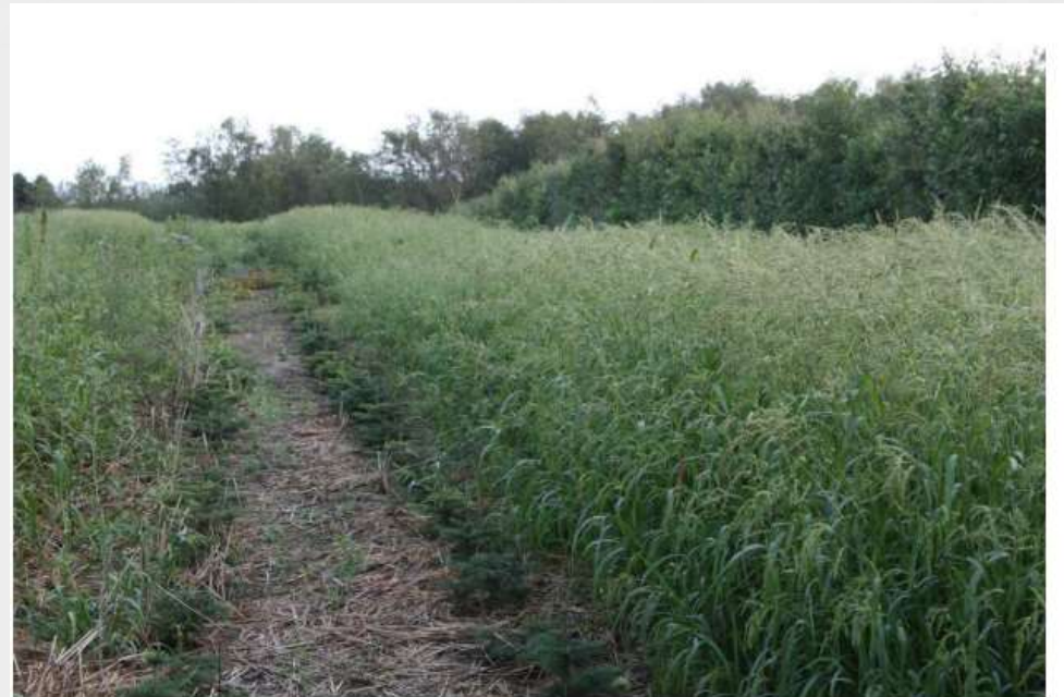
Hanesporen er fuldt udvokset i august-september og kan være op til 150 cm høj. I banen med synlige nordmannsgran er hanespore bekæmpet med et græsmiddel i starten af juni.