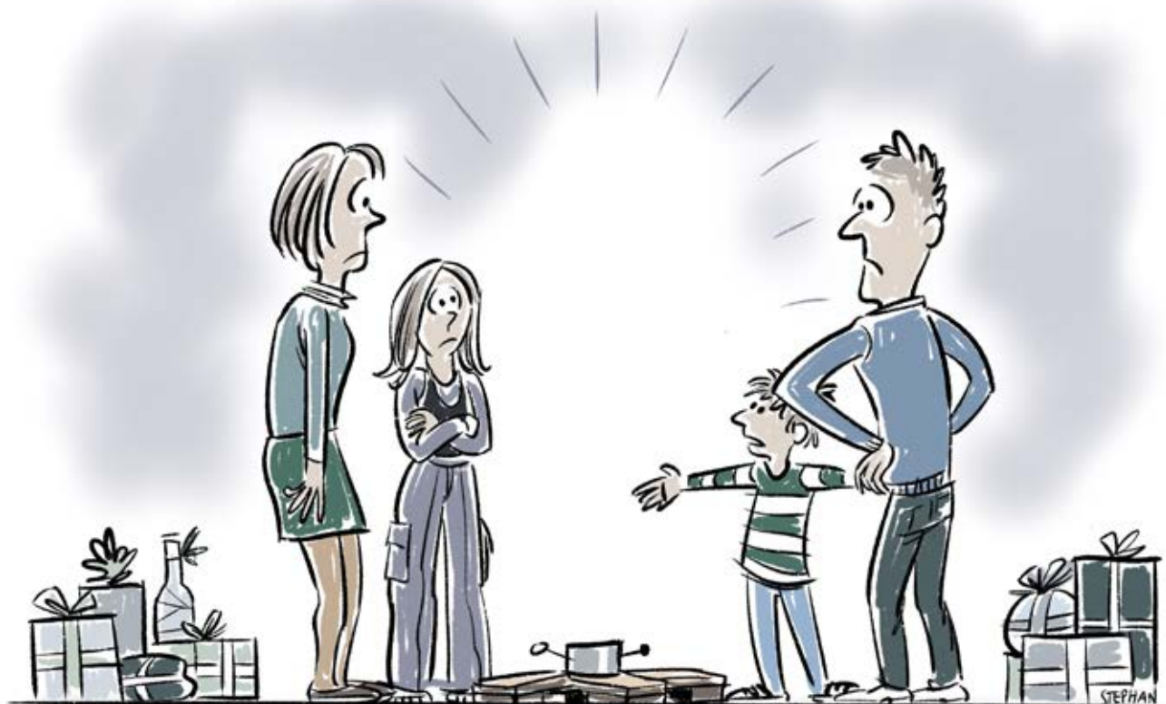
Illustration: Stephan Nielsen. Tekst: Werner Koop

Er dette stadig jul? Klart nej – og sådan kan det se ud om få år. Prisdumping ikke bare ødelægger hele vores branche, men også en tradition, der er en af årets og livets smukkeste: Julen.