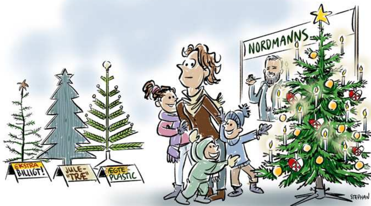
Illustration: Stephan Nielsen. Tekst: Werner Koop

Julen begynder for familien, når træet skal udvælges. Denne oplevelse får alle i den rette julestemning. Og for dem, der støtter op om den ægte juletradition, er der ingen tvivl. Alene et naturtræ kan komme på tale.