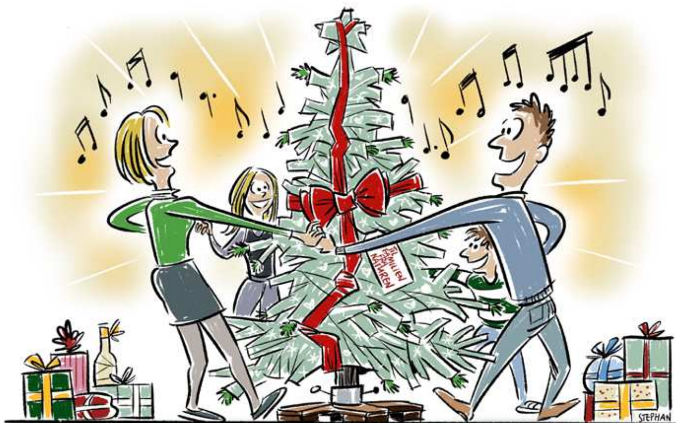
Illustration: Stephan Nielsen. Tekst: Werner Koop

Hvad ville julen være uden naturtræet? I generationer har det grandufterende juletræ været familiens samlingspunkt i juledagene. Det er svært at forestille sig en jul uden et træ.