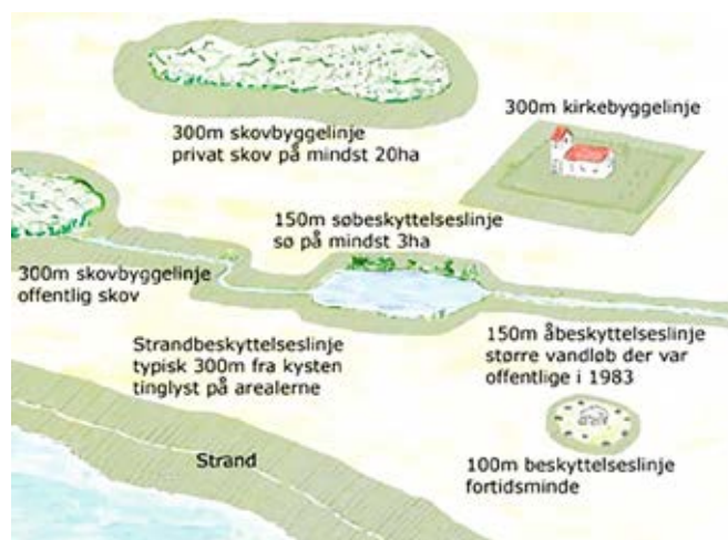
De forskellige beskyttelseslinjer i det danske landskab. Efter www.naestved.dk

Danske Juletræer anbefaler, at juletræer sidestilles med landbrug i relation til afstandskrav, men at der af hensyn til udsynet