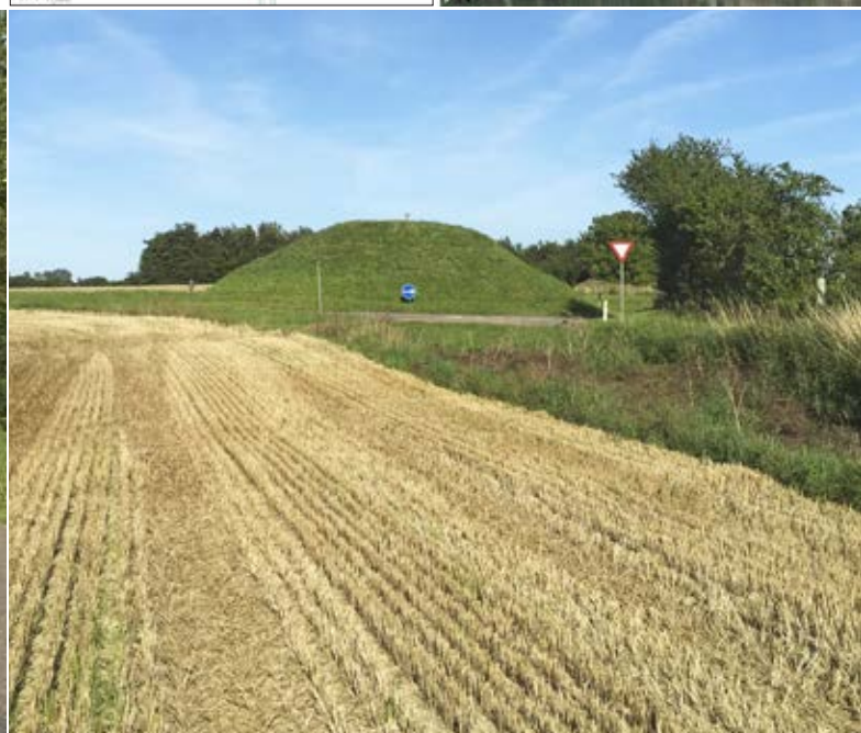
Kommunal kreativitet i anlæggelsen af en rundkørsel rundt om en gravhøj i Svendborg kommune. Bemærk hvordan beskyttelseslinjen påvirker store dele af de omkringliggende ejendomme.