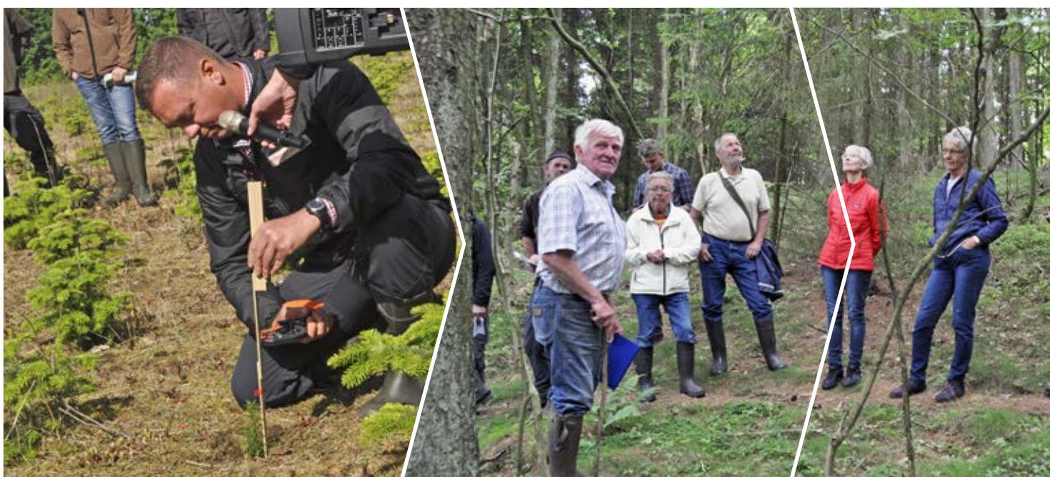
Foto-potpourri af MARKVANDRINGERNE 2017