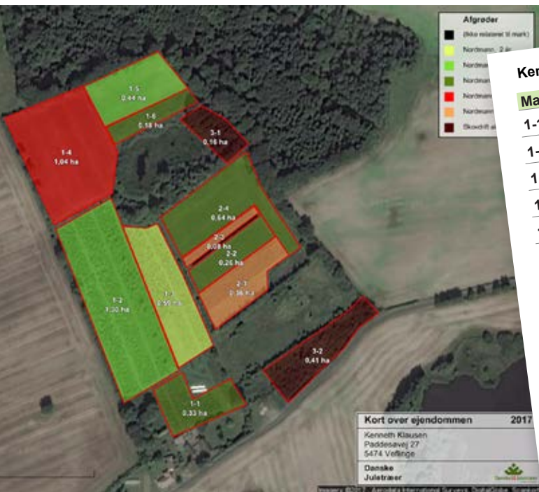
Eksempel på kort og markplan.