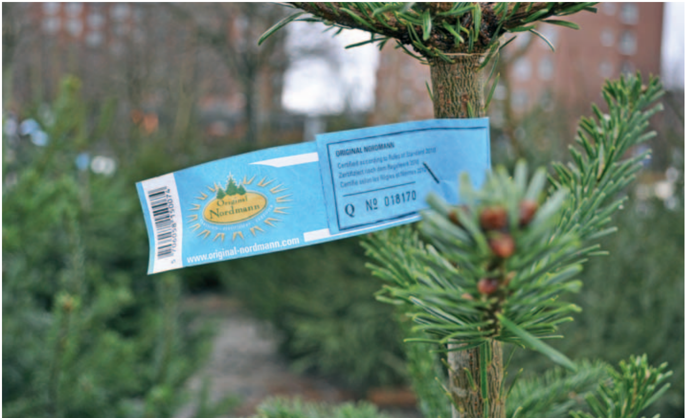
Certificeret Original Nordmann er et varemærke, som anvendes som et kvalitetsstempel af flere grossister i branchen.

og anerkendt i detailhandlen, og da den imødekommer de udfordringer og forhold, som gør sig gældende i en effektiv og professionel produktion.