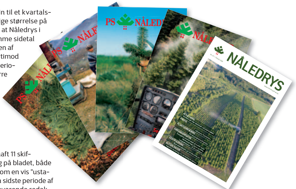
Her ses forsiderne fra venstre mod højre; 34, 39 51, 69 og 97.