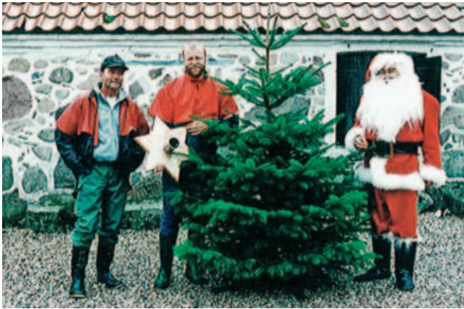
Danmarks flotteste juletræ (eller Julemand) anno 1994. Ville den også vinde på Langesømessen anno 2017 eller....

Det kan ikke komme som nogen overraskelse, at den træart, der oftest er blevet beskrevet er nordmannsgran, skarpt forfulgt af nobilis. På de næste pladser kommer lasiocarpa og rødgran. Leder man længe nok, kan man imidlertid også finde artikler om bjergfyr, blågran, buskbom, contortafyr, kristtorn, troldpil, troldhassel og ædelcypres for blot at nævne nogle. Nåledrys er efterhånden en ganske stor videndatabase for pyntegrønt, men for at udnytte den optimalt bør man alliere sig med søgefunktionen på vores hjemmeside.