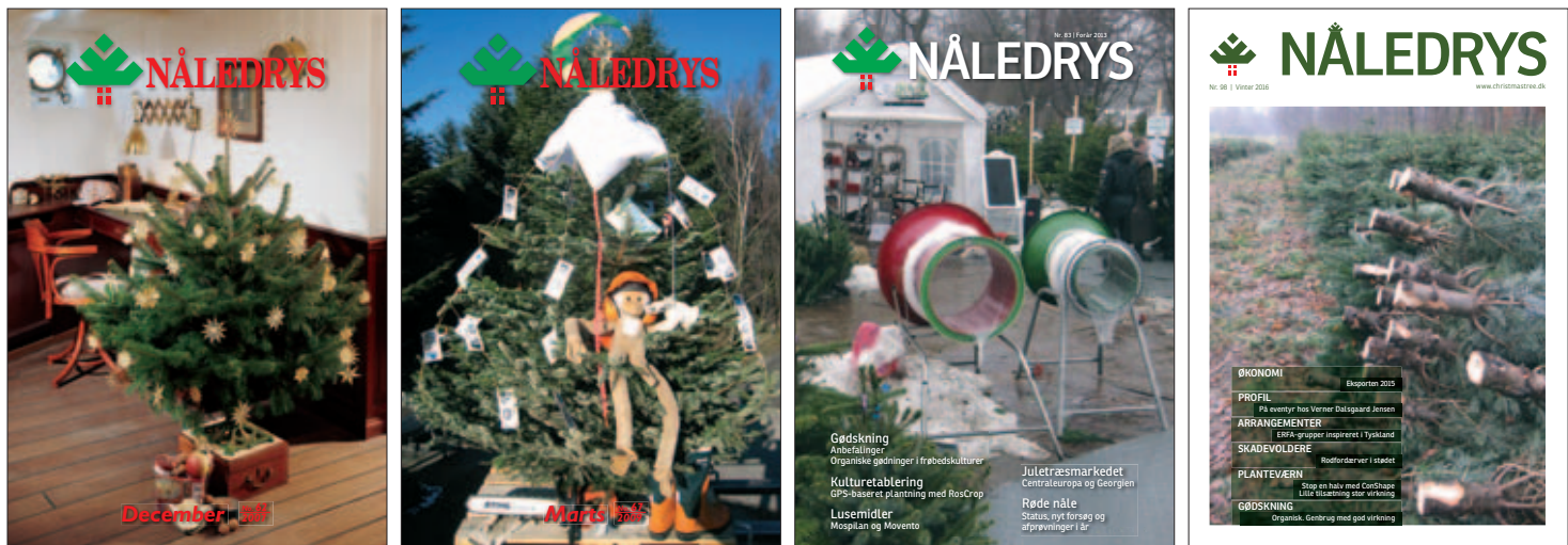
Eksempler på forsider fra Nåledry s: Fra venstre mod højre; 6, 12, 22, 33, 62, 67, 83 og 98.

Nåledry s gik fra at være et halvårligt magasin til et kvartalsmagasin. Frem til år 2012 lå den gennemsnitlige størrelse på Nåledry s på 50 sider. Dengang forventede vi, at Nåledry s i de efterfølgende år ville ligge på omtrent samme sidetal eller måske endda mindre, bl.a. fordi porteføljen af PAF-projekter løb ud. Sådan gik det ikke. Tværtimod nåede Nåledry s op på 68 sider i gennemsnit i perioden efter 2012, blandt andet som følge af et større islæt af profilartikler (producent, maskin- og planteskoleprofiler), flere grundlæggende artikler og fyldigere "norske sider". Statistiken siger, at det mindste Nåledry s var på 32 sider (nr. 30) og det største på 84 sider (nr. 82). Gennemsnittet ligger pt. på 54 sider.