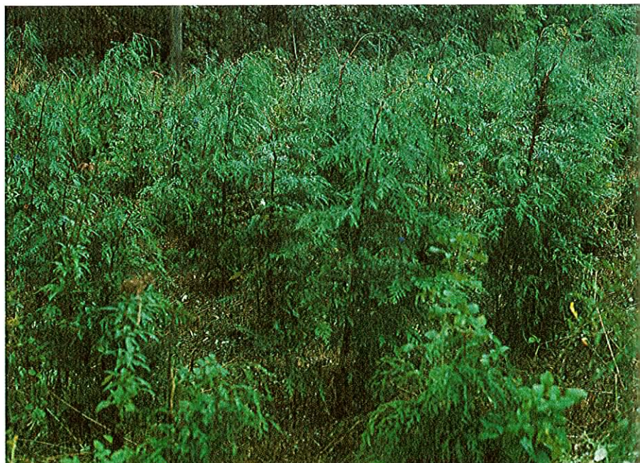
Figur 1. Stærkt tilgroet cypreskultur.