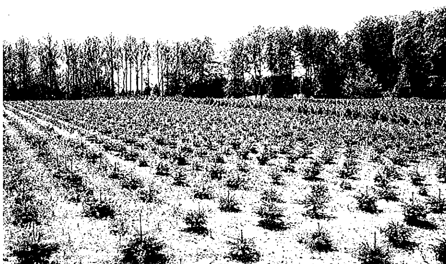
Figur 1: Mange arealer er ikke med i skovtællingen 1990.

I tabel 1 er nobilis- og nordmannsgran-arealet fordelt på Øerne og Jylland samt på anlægsårgange. Alderklassefordelingen for henholdsvis nobilis og nordmannsgran er ligeledes illustreret i figurerne 2 og 3. For at muliggøre mere detaljere-