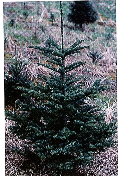
Figur 2. På nobilis lades den øverste grenkrans urørt ved tilklippingen.