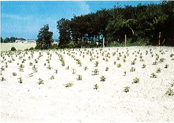
Fig. 1: Pyntegrøntsektionens bestyrelse fik på generalforsamlingen bemyndigelse til i samarbejde med Dansk Skovforening at påbegynde forhandlinger med de relevante parter om etablering af produktionsafgift for juletræer og pyntegrønt.