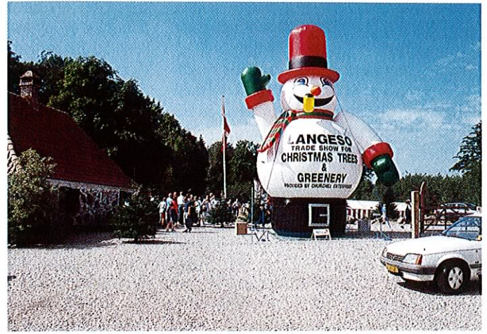
Fig. 2: Med over 1.500 besøgende blev Langesømessen en stor succes i sin „genfødte“ form.

strikter, som dels er medlem af Sektionen, dels har en observatørpost i bestyrelsen. Pyntegrøntsektionen er dog opmærksom på eventuelle problemstillinger, som kan opstå som følge af, at den miljømæssige regulering og branchens erhvervmæssige tiltag administreres i et og samme ministerium.