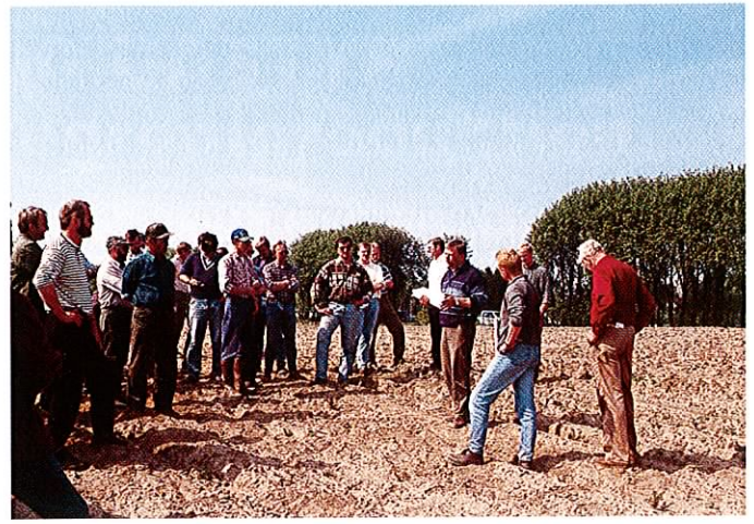
Fig. 7: Pyntegrøntsektionens markvandringer blev igen i 1995 en god anledning for juletræs- og klippegrøntsproducenter til at samles i marken.

de tilgængelige sprøjtemidler. Det er Pyntegrøntsektionens holdning, at der desuden er behov for en styrkelse og en bedre koordinering af den eksisterende forskning, ligesom der er behov for en øget viden om flere skadevoldende insekter, ikke mindst nordmannsgranens galmide.