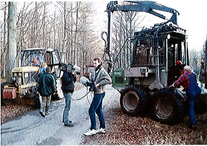
Fig. 5: I 1995 blev Pyntegrøntsektionen i hidtil uset omfang kontaktet af pressen for oplysninger om juletræer og den danske produktion heraf. Også i 1995 var der tiltag til ofte usaglige, deciderede negative historier, som heldigvis blev „kvalt“ før de nåede at blive spredt, og eventuelt „galoperede“ til udlandet.