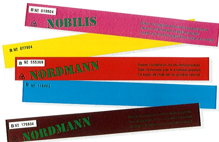
Fig. 3: Med flere farver og iøjnefaldende etiketter med forbrugeroplysninger fik Pyntegrøntsektionens juletræsetiketter med 2,25 mio. udleverede stk. sit store gennembrud.