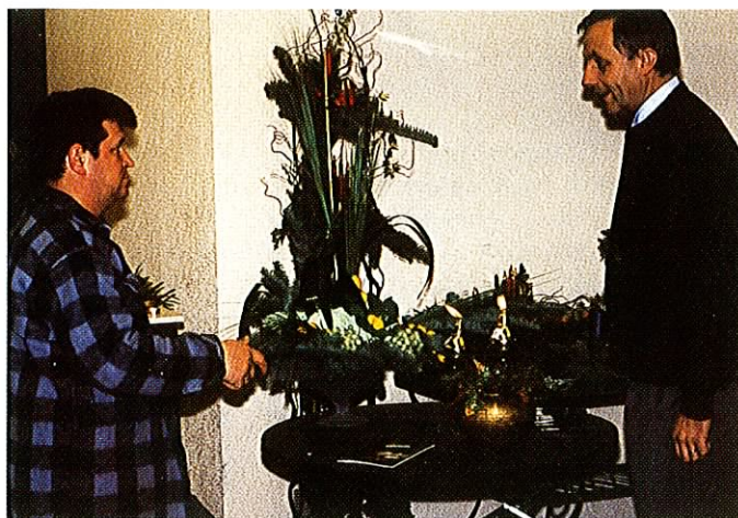
Fig. 4: Afsætningsprojektet for nobilis klippegrønt på det franske marked blev afsluttet med udgangen af 1995. Projektet har været branchens store satsning på at introducere nobilis i Frankrig. Projektet kører videre med 2. fase i 1996.