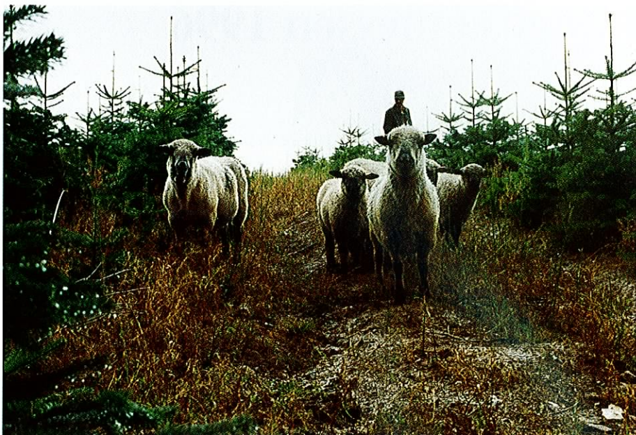
Figur 1: Brugen af får i juletræskulturer er blevet meget populært. Mange steder er der brug for kyndig rådgivning for at undgå, at en god ide tabes på gulvet.

fåregræsning forudsætter får, der er tilvænnet denne type græsning, mandskab der er interesseret i og vidende om får, og sidst men ikke mindst har tid til at observere og reflektere. Dette kan være svært at få til at harmonere med effektivitet, tempo og arbejdstidsregler.