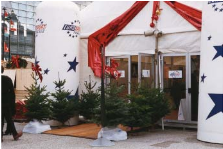
Figur 5. Danske nordmannsgran juletræer blev markedsført i Frankrig. En af salgsaktionerne foregik i den såkaldte "Julelandsby" i la Defense, Paris ved den nye Triumfbue, udført af den danske arkitekt von Spreckelsen. Således var nordmannsgranen også flot repræsenteret både udenfor og indendørs ved presse-mødet i "Julelandsbyen".

Overvågningen af markedet for juletræer og pyntegrønt er en vigtig opgave for Juletræsdyrkerforeningen. Da sæsonen afvikles på kort tid og handelen ofte foregår ret hektisk, er det væsentligt, at markedet gøres så gennemsigtigt som muligt. Juletræsdyrkerforeningen følger salgets udvikling i Danmark og i udlandet og rådgiver medlemmerne om afsætningsaf deres varer. Markedsovervågningen kommunikerer bredt ud gennem PS Naledrys Korte Meddelelser. På dansk plan sker markedsovervågningen gennem en tæt kontakt til producen-