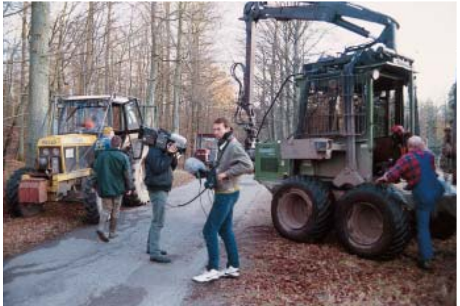
Figur 2. PR-indsatsen og presseberedskabet blev i 1997 bedre på de vigtigste europæiske markeder. Med et "Informationszentrum Nordmanntanne" i det tyske og et tilknyttet pressebureau i Frankrig fik dialogen med pressen et løft i forhold til tidligere. Det lykkedes bl.a. at få et fransk TV hold til Danmark.

Foreningen fik i 1997 49 indmeldelser og 30 reelle udmeldelser. Dermed havde foreningen 634 medlemmer d. 31.12. 1997. Foreningens ordning, hvor nye medlemmer kan få første års medlem-