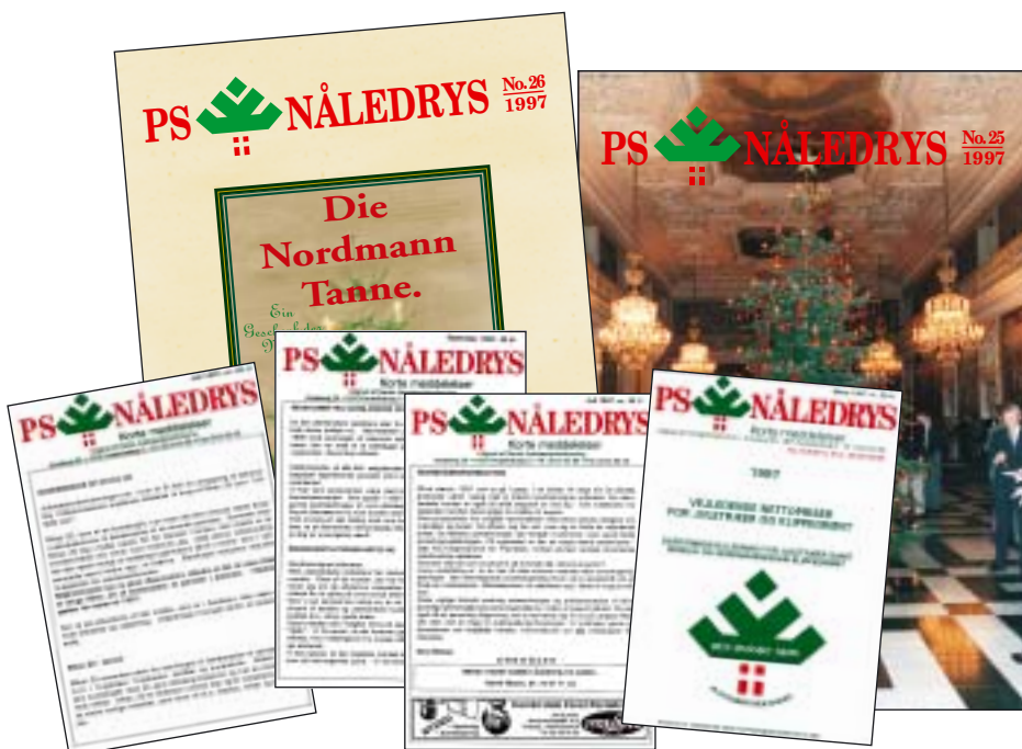
Figur 1. Foreningens tidsskrifter PS Nåledrys: magasinet og Korte Meddelelser udgjorde også i 1997 en vigtig del af kontakten til medlemmerne. Med 2 nr. af magasinet og 50 nr. af Korte Meddelelser i 1997 kunne medlemmerne føle sig velinformeret om branchen.