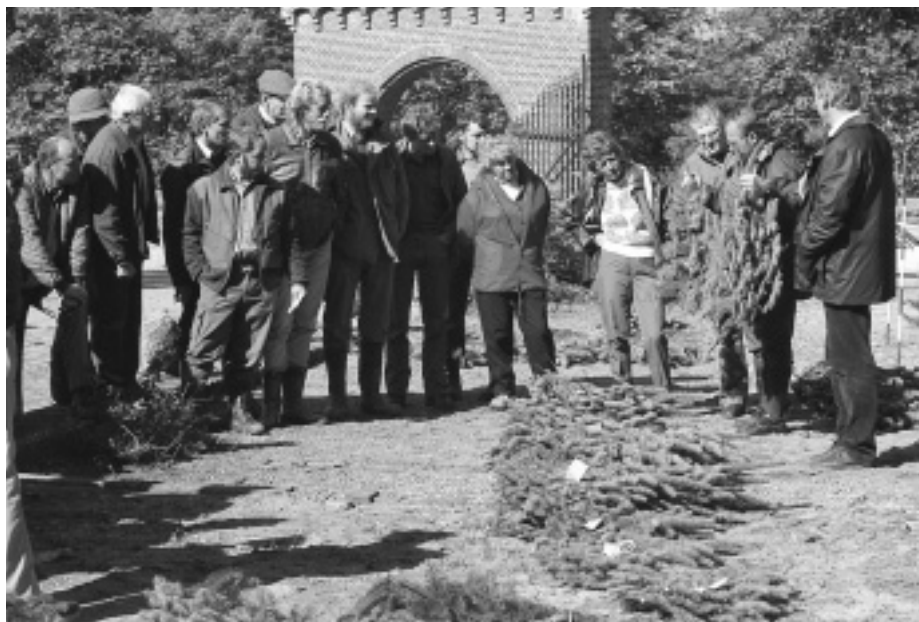
Figur 3. Sorteringsmøder for hhv. klippegrønt og juletræer var også i 1997 en vigtig bestanddel af kommunikationen af ensartede sorteringer og markedsinformation.