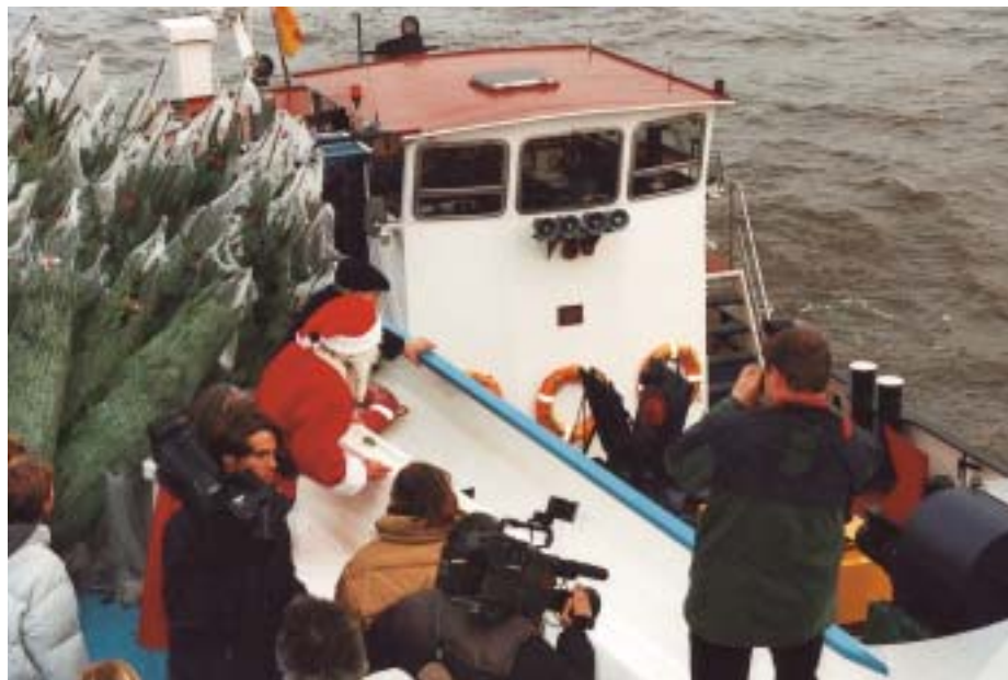
Figur 4. Afsætningsprojektet i Tyskland, Østrig og Schweiz havde som en vigtig og vellykket aktivitet afholdelsen af en pressekampagne i Hamborg Havn ombord på færgen "Hamborg". Både den skrevne og den elektroniske presse var godt repræsenteret, hvilket bragte nordmannsgran juletræerne og varemærket "Original Nordmann Tanne" ind i de tyske stuer.

Juletræsdyrkerforeningen præsenterede i 1997 en helt ny og forbedret "Homepage" på Internettet. På adressen