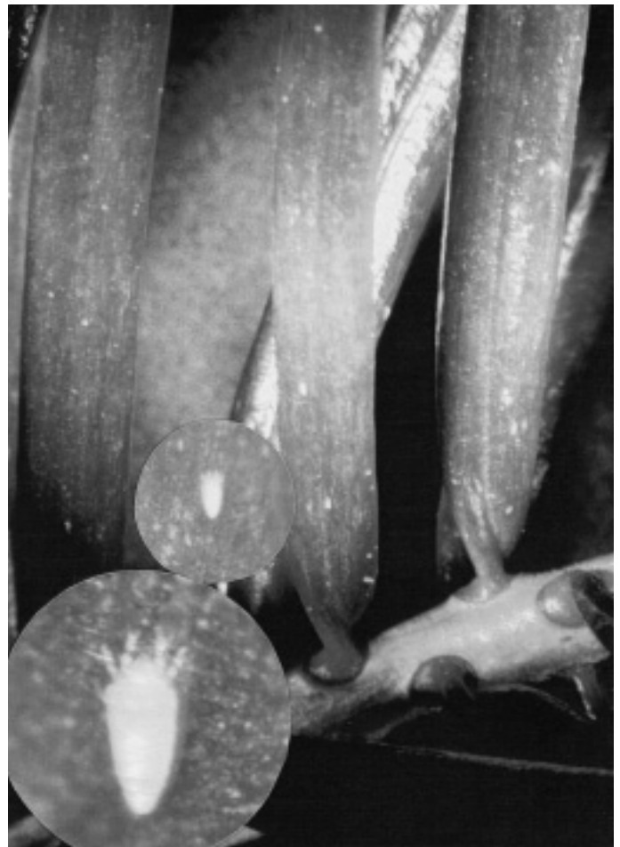
Figur 7. Efter flere tørre og varme år i træ blev galmiderne i nordmannsgran igen i 1997 flere steder et problem. Situationen blev forværret af, at dispensationen for den eneste godkendte bekæmpelsesmetode efter lang tids venten først kom midt på sommeren.

højdeinterval, eller om utilstrækkelig oparbejdning. Disse sager skyldes for det meste manglende professionalisme hos den ene af parterne. I sådanne sager er udfaldet næsten givet på forhånd, og det største problem er oftest at få varerne synet, idet mangelen ofte først opdages hos slutkunden.