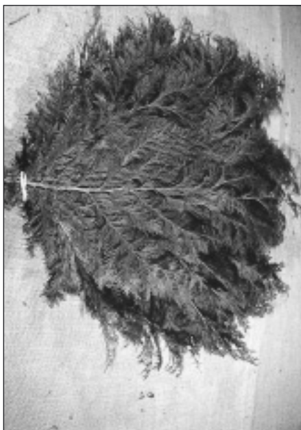
Billede 4. Analyse af cypresmarkedet kan måske føre til større afsætning af cypres.

dyrkningsituationer og mellem plantekvalitet og etableringssevne.