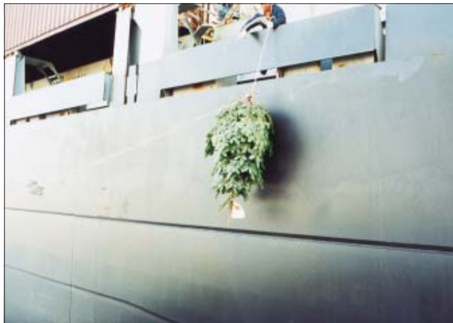
Billede 1. Et nordmannsgran juletræ hives om bord på et af de containerskibe, der vil være på farten juleaften. I træets top hænger en julehilsen fra "Original Nordmann".

betyder nogen gange, at fonden bliver nødt til at ulejlige de retskafne med ekstra oplysninger for at kunne sortere i de data, vi har til rådighed og på den måde finde frem til