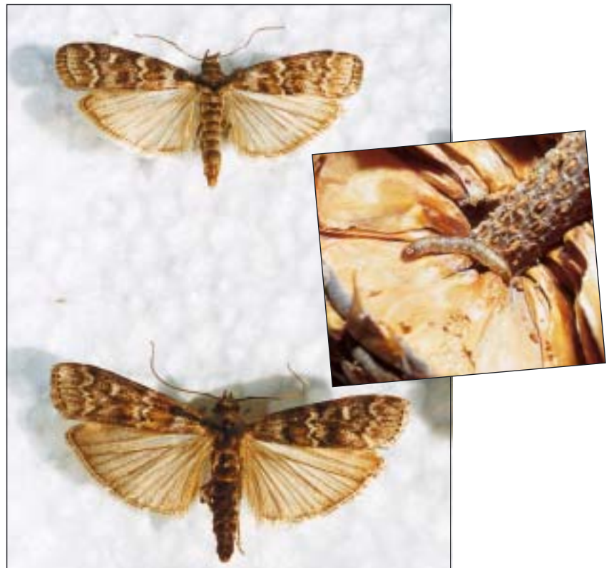
Billede 3. Fondspenge er bl.a også givet til projektet “Koglehalvmøl - fænologi og bekæmpelse”.

Blandt andet til forskningsprojektet “Abies nordmanniana: Forekomst af mycorrhiza i barrodsplanter i relation til etableringsevne og tilvækst efter udplantning.” Målet med projektet er at undersøge forholdet mellem mycorrhiza-dannelsen på nordmannsgran udplantningsplanter i relation til forskellige