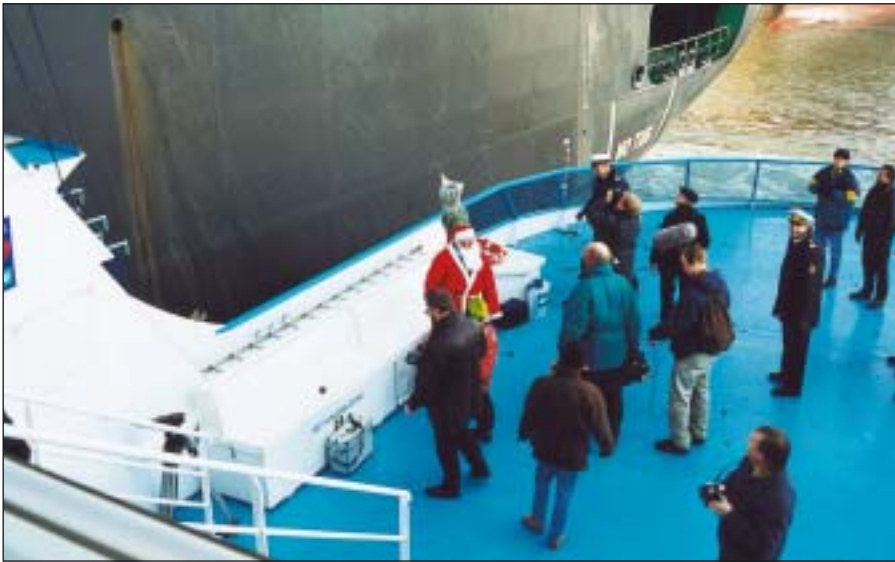
Billede 2. Uddelingen af juletræer til sømændene var autoriseret af selve julemanden. Pressen var repræsenteret i stort antal ved denne aktion, som kunne følges både på flere tyske TV-kanaler og i flere radioprogrammer.

“synderne”. Sidst vi har måttet ulejlige juletræs- og pyntegrøntproducenterne er med den årlige indberetning. Ud over eventuelle ændringer i dyrkningsarealerne har vi bedt om ejendoms- og kommunenummer. Det har vi gjort, fordi vi med disse numre kan genkende betalerne på de digitale kort, vi bruger i kontrolproceduren.