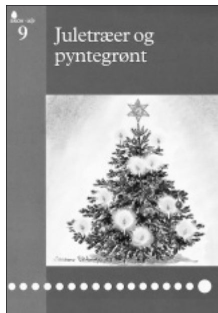
Billede 5. Skov-info hæfte nr. 9 om juletræer og pyntegrønt er genoptrykt med støtte fra Produktionsafgiftsfonden.

Produktionsafgiftsfonden har givet tilskud til genoptryk af det lille skov-info hæfte nr 9 "Juletræer og pyntegrønt". Et lille nyttigt