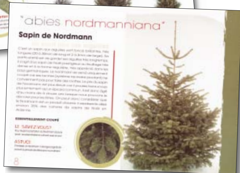
Uddrag fra den belgiske folder om de enkelte arters fordele og ulemper.

disse skæres af inden levering til handelsledet.