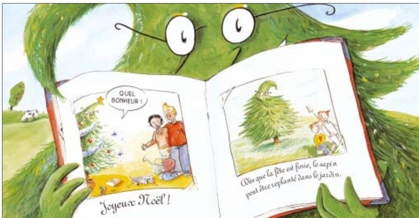
I tegneserieform fortæller det rare juletræ sin historie til de kommende forbrugere.

kan mellemhandlerledet ligeledes få oplysninger om de markedsfremmende aktiviteter.