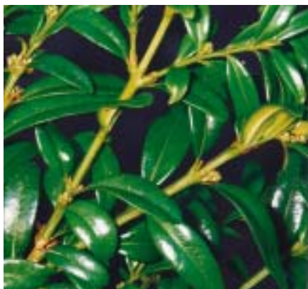
Spidsbladet buksbom ( Buxus sempervirens 'angustifolia').

Grenene klippes af og samles i buketter, hvis aftageren er en grossist. Leveres der direkte til blomsterhandlere pakkes grenene normalt i sække.