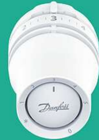
Danfoss Redia ™