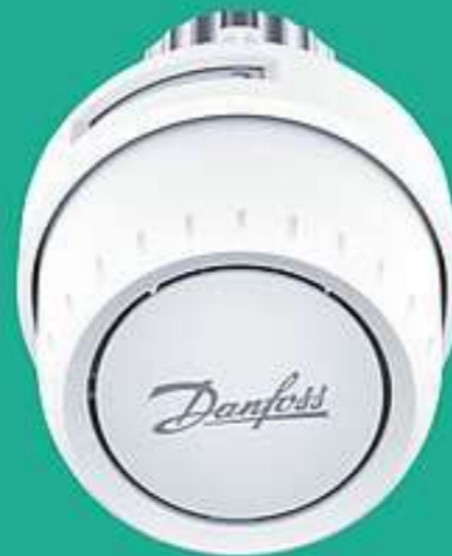
Danfoss Aveo ™ Behördenmodell