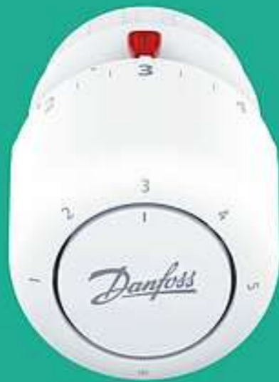
Danfoss Aero ™