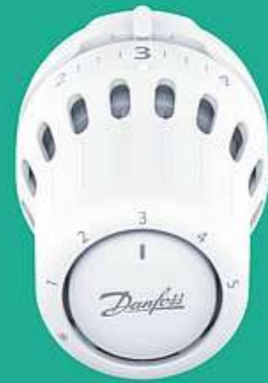
Danfoss React ™