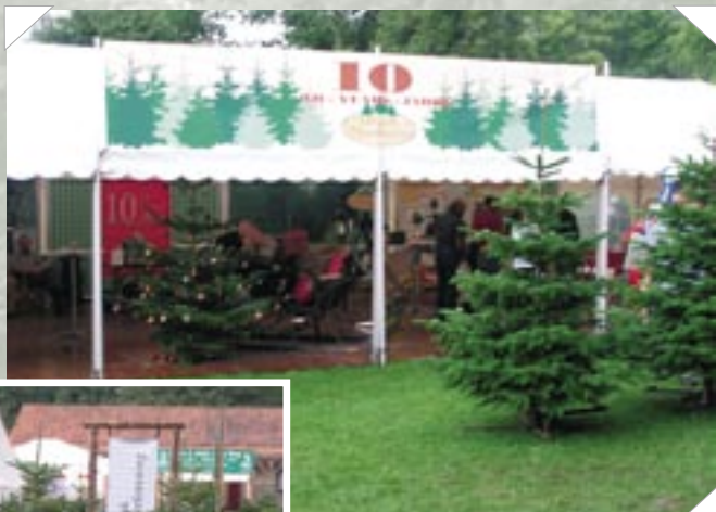
Stor aktivitet på den kombinerede DJ og ON stand.

Hos Bols Planteskole kunne man finde et interessant bud på, hvorledes man kan introducere nye arter til klippegrønt- og juletræsmarkedet. Arten Thujopsis kan formes til at være et smukt juletræ, som i virkeligheden kan betragtes som en mellemting mellem en dekorationsartikel af klippegrønt og et juletræ. Og på den samme stand blev en lille håndboremaskine demonstreret. Nyheden var ikke maskinen, men det lille jordbor, som var monteret i stedet for et almindeligt bor. Med det er det muligt at fordoble arbejdspræstationen i forbindelse med plantning