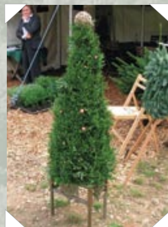
Fremtidens juletræ? – Tilklippet Thujopsis fra Bols Planteskole.