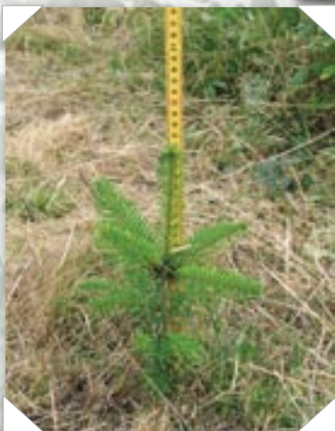
En forårsplantet Jiffy på demonstrationsarealet, som trods tørke har sat et næsten 10 cm topskud.