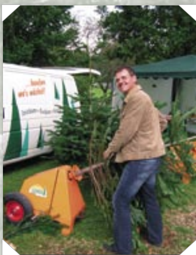
Efter en rystemtur i Gerners træryster er der hverken sne, blad eller løstsidende insekter tilbage i træet.