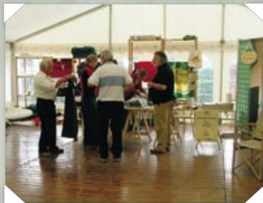
Travlhed på ON-standen, hvor man også fejrede, at ON kampagnen nu går ind på sit tiende år.