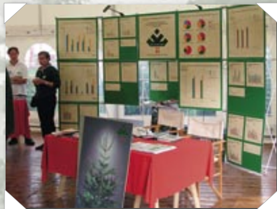
Den nyligt afsluttede undersøgelse af klippegrøntmarkedet i Tyskland blev præsenteret i DJ teltet.