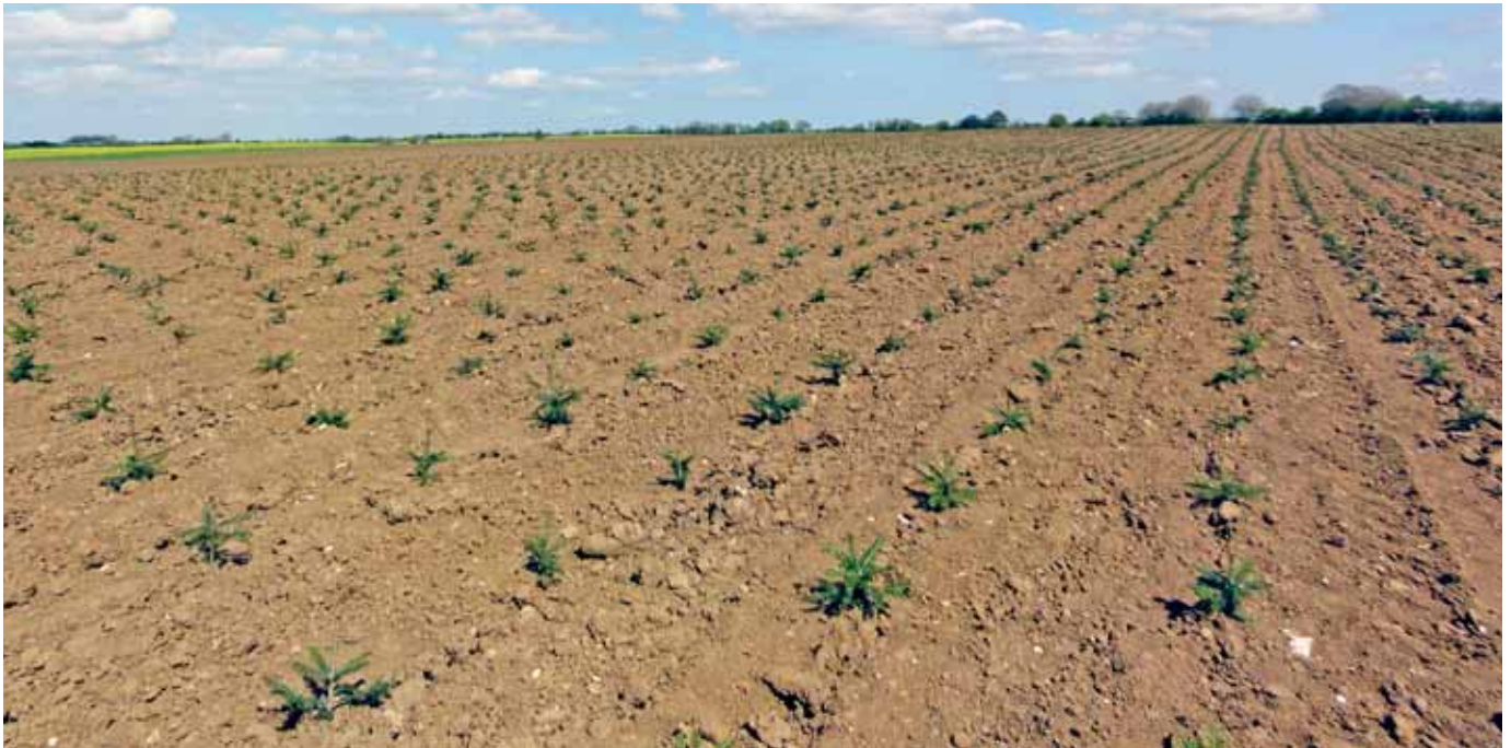
På ejendommen Fovsletgård er der tilplantet cirka 300 ha med nordmannsgran.