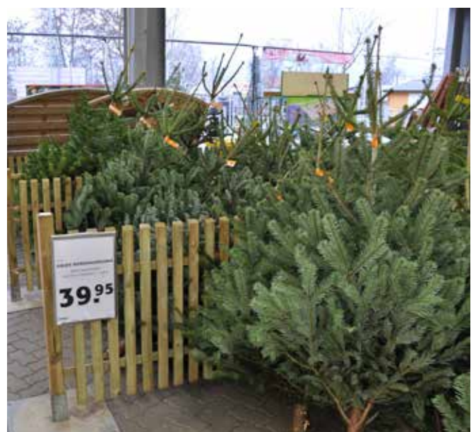
Gagebau Gartencenter i Wittstock i 2011.

Information og bestilling af tangen på www.TOP-STOP.dk