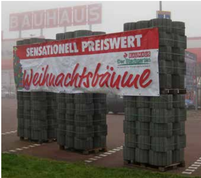
De store kæder slår især på prisen og ikke så meget på kvaliteten. Markedsføringen er til tider hård, især når butikskæderne ligger overfor hinanden som Bauhaus og Höffner i Barsbüttel.