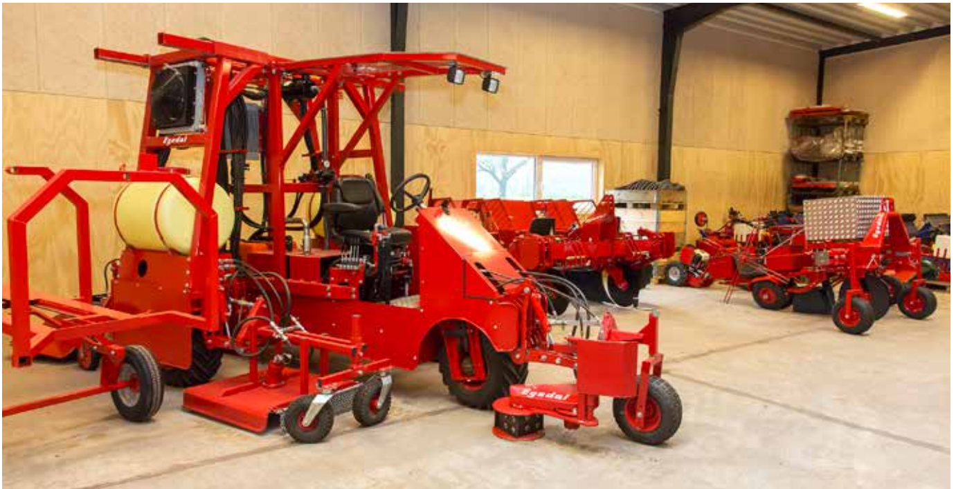
En stribe færdige produkter i hallen, hvor maskinerne står klar til levering.