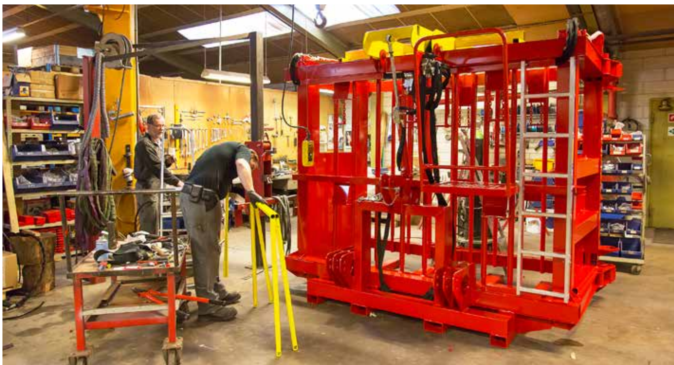
Dette er en af to juletræspakkere, som var ved at blive lavet ved besøget.

Udover de to er der også Anja Brask, som har kontakt til kunderne. Det er blandt andet hendes opgave at udarbejde tilbud på løsninger med videre.