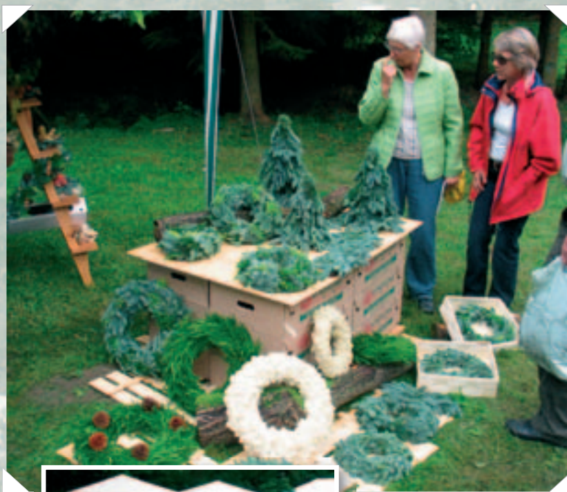
Flere udenlandske firmaer med speciale i bearbejdning af klippegrønt deltog i årets messe.

nyligt afsluttet PAF projekt. Den ene poster handlede om, at svampen Kabatina abietina i Norge jævnligt findes på nåle med de karakteristiske orange bånd og spidser (Talgø et al ). I modsætning hertil stod den danske poster, som afviste, at svampeangreb var årsagen til røde nåle i Danmark, men påpegede at nedbørsrige forår giver større risiko for røde nåle. Endelig var der en poster fra Nordvestamerika, som i lighed med de danske undersøgelser viste, at CSNN var en fysiologisk skade. Posterene illustrerede betydningen af genetik for røde nåle (CSNN) i nobilis, herunder at afkom af danske frøplantager havde lav tilbøjelighed til at få røde nåle (Chastagner et al ). Som man kunne forvente, var der også blandt dyrkerne flere meninger om årsagen til røde nåle hos nordmannsgran og den udstillede "uenighed" blandt forskerne udløste livlig snak. Ikke mindst blandt en stor gruppe tyske gæster, som besøgte standen som del af en guidet tur under ledelse af Hans Ber-