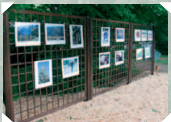
"Fra frø til plante" var temaet på denne udstilling hos Johansens Planteskole.

Derimod kan man sige, at der var en langt mere optimistisk og positiv stemning blandt