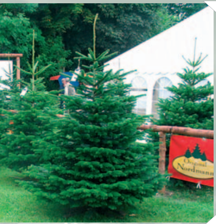
Kandidater til prisen som Danmarks flotteste juletræ.

Som altid modtog alle træer stemmer, men der var dog større spredning i år end tidligere. Helt grundlæggende kan man sige, at der stadig medbringes mange træer til konkurrencen, som er formreguleret i en eller anden form. Det gælder for omkring 70-80% af alle konkurrence-deltagerne. Men når de 5 bedst placerede træer bæres ud til