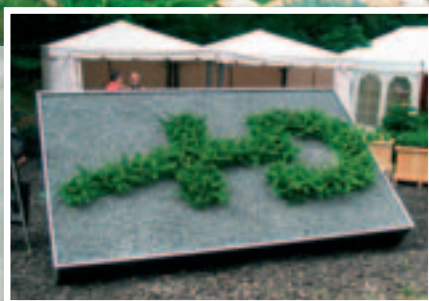
HedeDanmark havde begået dette logo udformet af salgsklare planter i kasser.