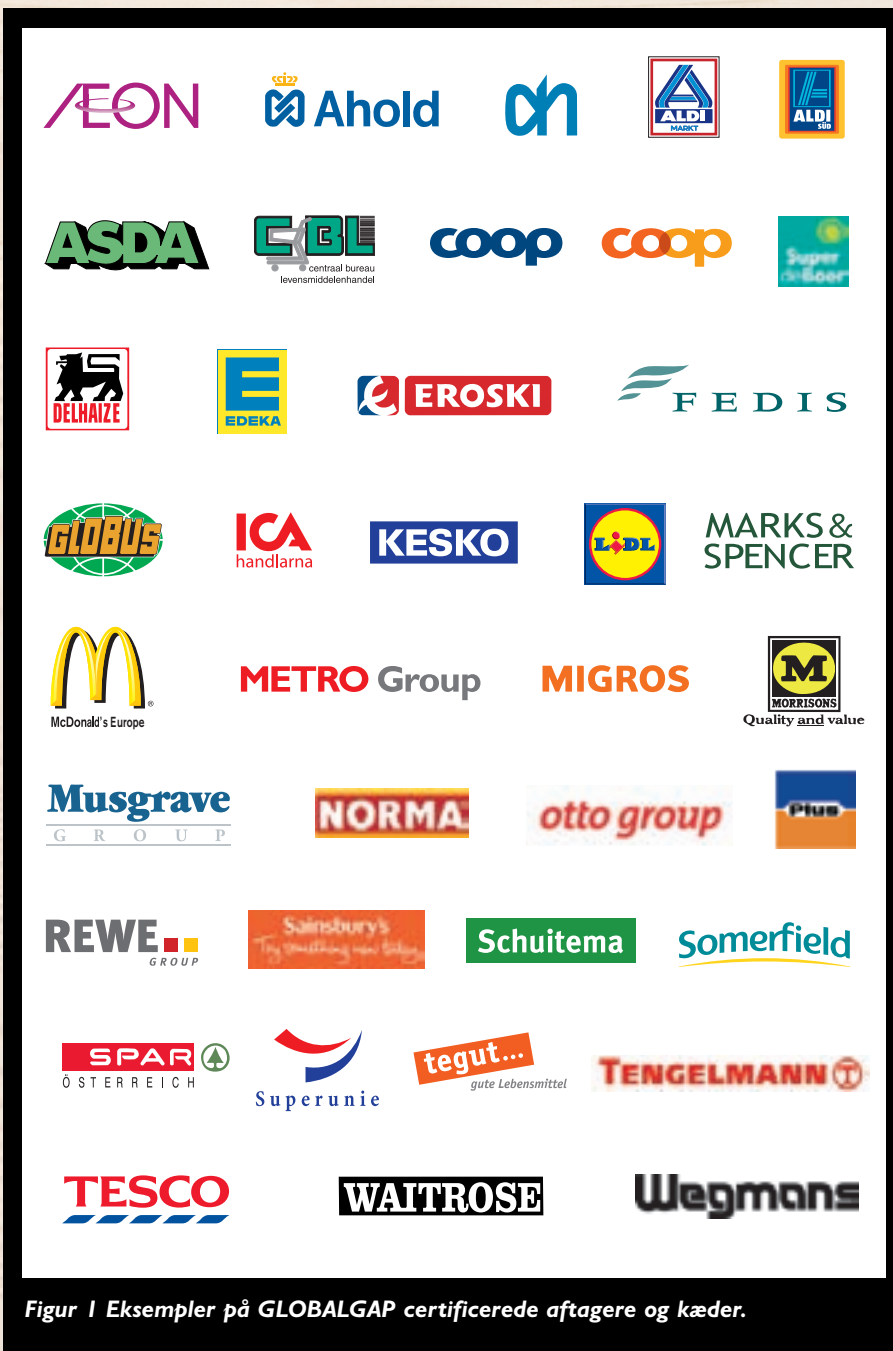
Figur 1 Eksempler på GLOBALGAP certificerede aftagere og kæder.

tige registreringer, og man vil til enhver tid kunne overholde kravet om dokumentation fra myndighederne.