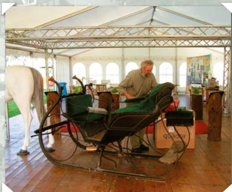
De sidste ting gøres klar inden det store ryk ind på ON/DJ standen.