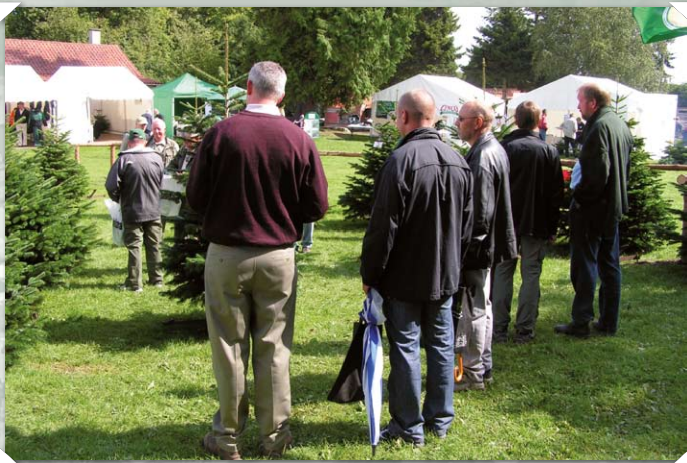
De konkurrerende træer tages i øjemål.

www.skaerbaekmaskinforretning.dk · info@skaerbaekmaskinforretning.dk