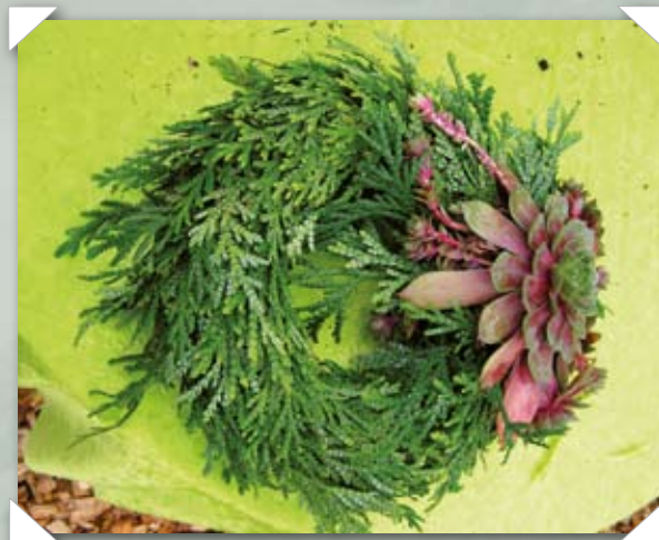
Flere udenlandske firmaer med speciale i bearbejdning af klippegrønt deltog i årets messe.