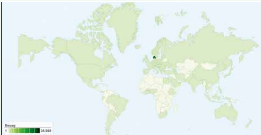
Her kom de besøgende fra på foreningens hjemmeside i 2009.

logiske træer og særligt efter jul skaderne på juletræer efter den lange vinters intensive vejsaltning.