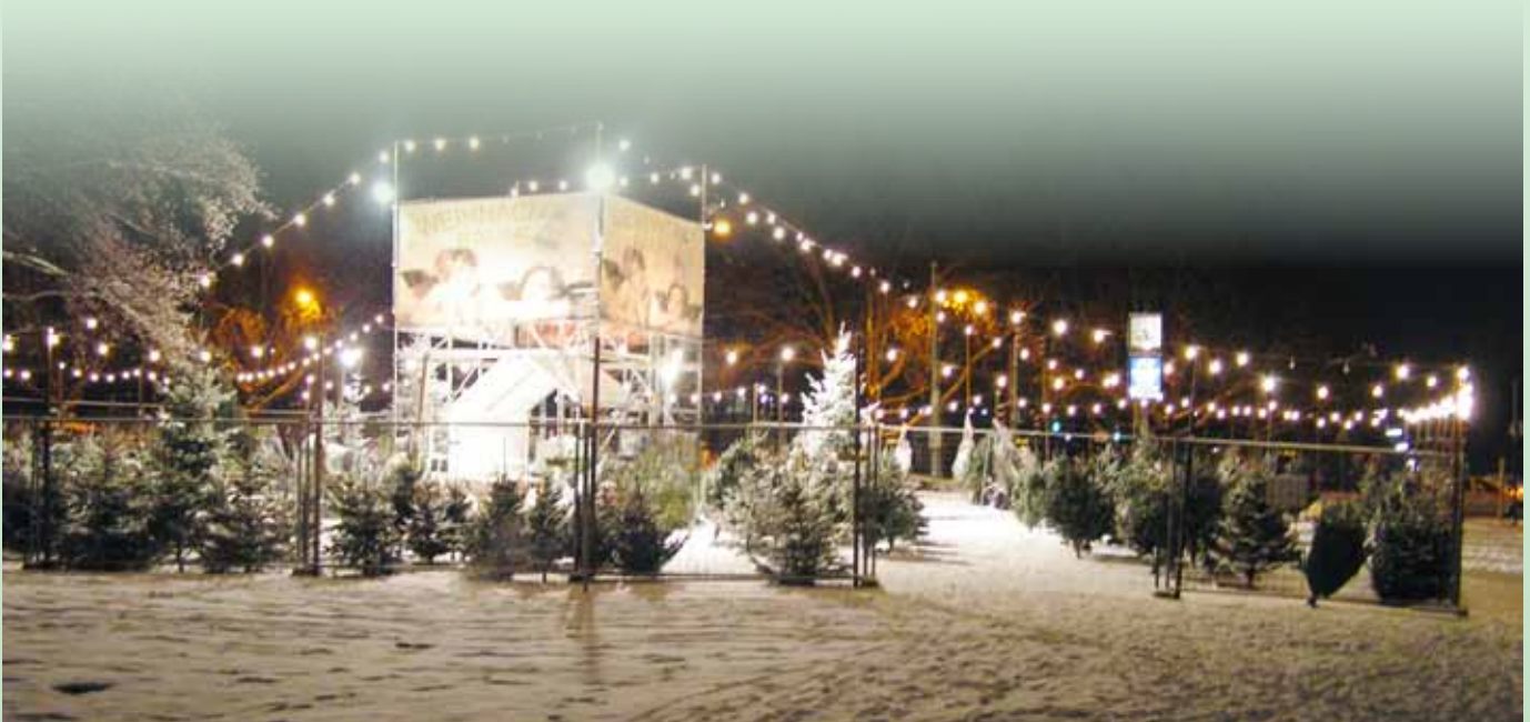
Stadeplads nær Frankfurt den 20.12 2009 – bemærk den store mængde sne, som også besværliggjorde transport af juletræer i disse sidste vigtige dage op til jul.

Markvandringerne blev i 2009 for første gang delt op i henholdsvis et formiddags- og et eftermiddags arrangement. Formålet med dette var at prøve med heldagsarrangementer i et lokalt område, hvor det var muligt om formiddagen at besøge et forsøgsanlæg med fremlægning af forsøgsresultater og om eftermiddagen at besøge en producent og se og opleve de spændende ting, der følger med dette.