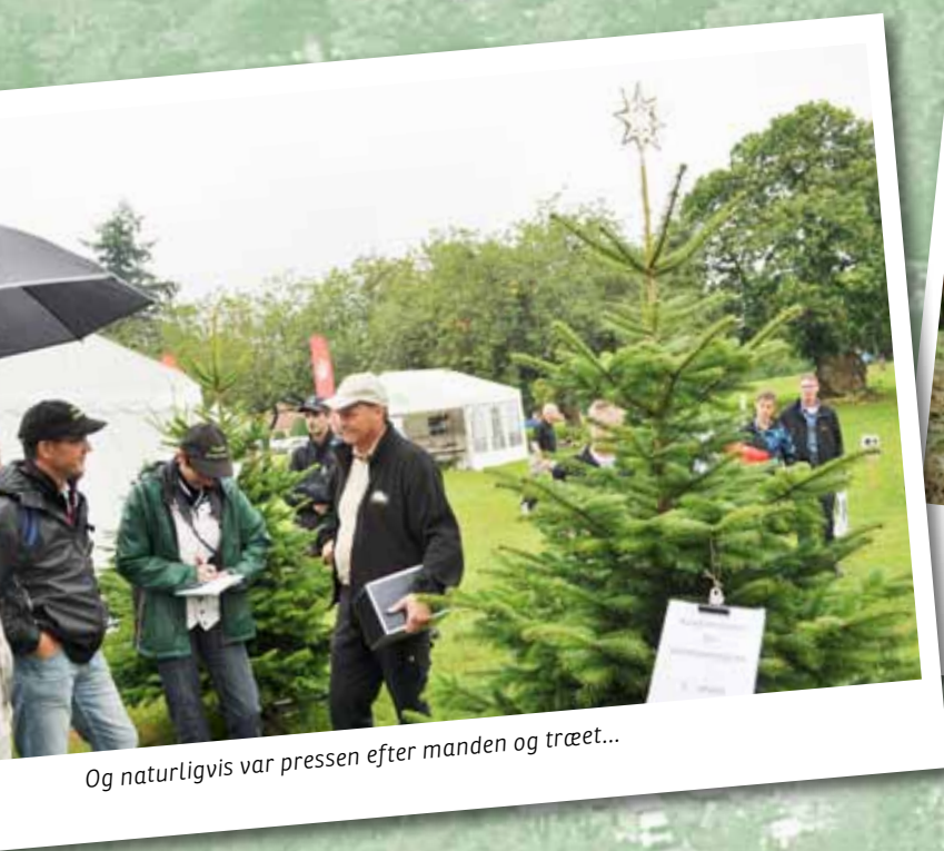
Og naturligvis var pressen efter manden og træet...