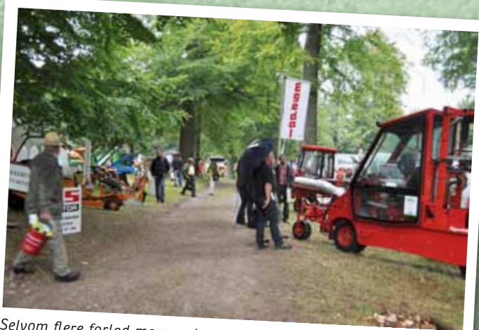
Selvom flere forlod messen da regnen kom, var der alligevel mange tilbage, der trodsede regnen med et kig på maskinudbudet.