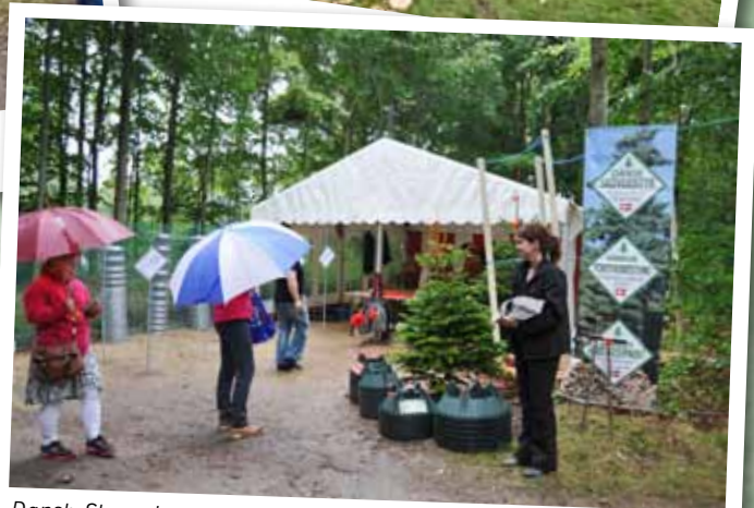
Dansk Skovudstyr trodser eftermiddagsregnen og får "fisket" nogle paraplyer ind på standen.