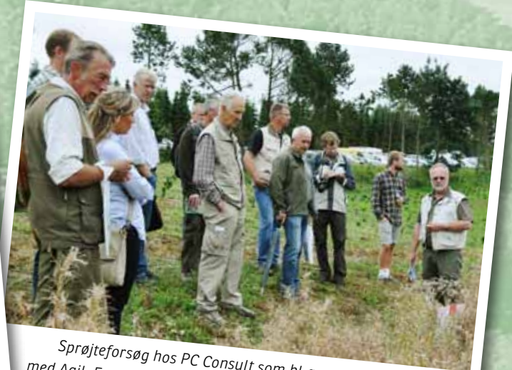
Sprøjtetest hos PC Consult som bl.a. medtog behandlinger med Agil, Focus Ultra, Accurate, Legacy, Glyphogan, Valdor, Logo, Round Bio mv. Her en sommerbehandling med Focus Ultra 2,5 l/ha (100g/l cycloxydim) + Dash, udsprøjtet 8. juni.