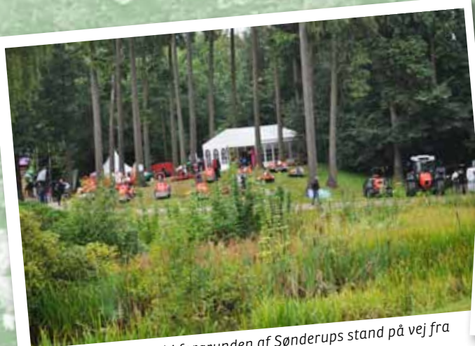
Det smukke vandhul i forgrunden af Sønderups stand på vej fra pladsen ved hovedindgangen til skoven.

På Langesømessen kan den professionelle juletræsdyrker eller klippegrøntproducent kort sagt se og høre om alt der vedrører branchen. Lige fra frøproduktion og planteskolernes store udvalg af diverse udplantningsplanter, pottedroede træer, gødning og planteværnsmidler, håndværktøj, tøj, certificering, diverse portaltraktorer, netmaskiner, gødningsmaskiner, rotorklippere, lifte og kombimaskiner og meget meget mere. Skov & Landskab (KU) præsenterer forskningsresultater og her kan man også få en snak om f.eks. rodfordærver og honningsvamp. Og selvfølgelig kan man også få rådgivning om dyrkning, afsætning, sortering og medlemservice, herunder blive meldt ind hos Danske Juletræer. Det var der mange, der gjorde i år. Messens mange deltagere fra udlandet gør at Langesø fortsat betragtes som den største internationale juletræsmesse i Nordeuropa. ■