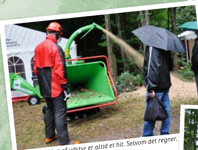
Demonstration af udstyr er altid et hit. Selvom det regner.

Forpladsen i eftermiddagens regn- vejr. Der er mange, der besøger den fælles stand med Skov & Landskab og Danske Juletræer. Her er der dog ekstra mange der er søgt i ly for regnen. Konkurrencen om årets juletræ trækker altid mange besø- gende til. I år var der afgivet i alt 278 stemmer på træerne.